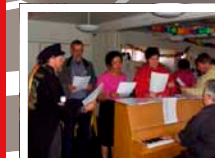
Hjemløsekoeret synger dagen igang