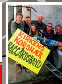
Musik: Baggårdsbandet spiller op til festlig afsked