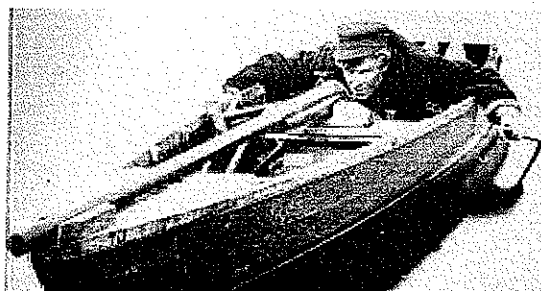
Fjenden i sigte

I dag, er der næppe nogen, der ville drive jagt på denne måde. Desuden er der fremkommet patroner i kaliber 12, der indeholder flere hagl, end der kan fyldes i en kaliber 8, nemlig knap 50 gram blyhagl.