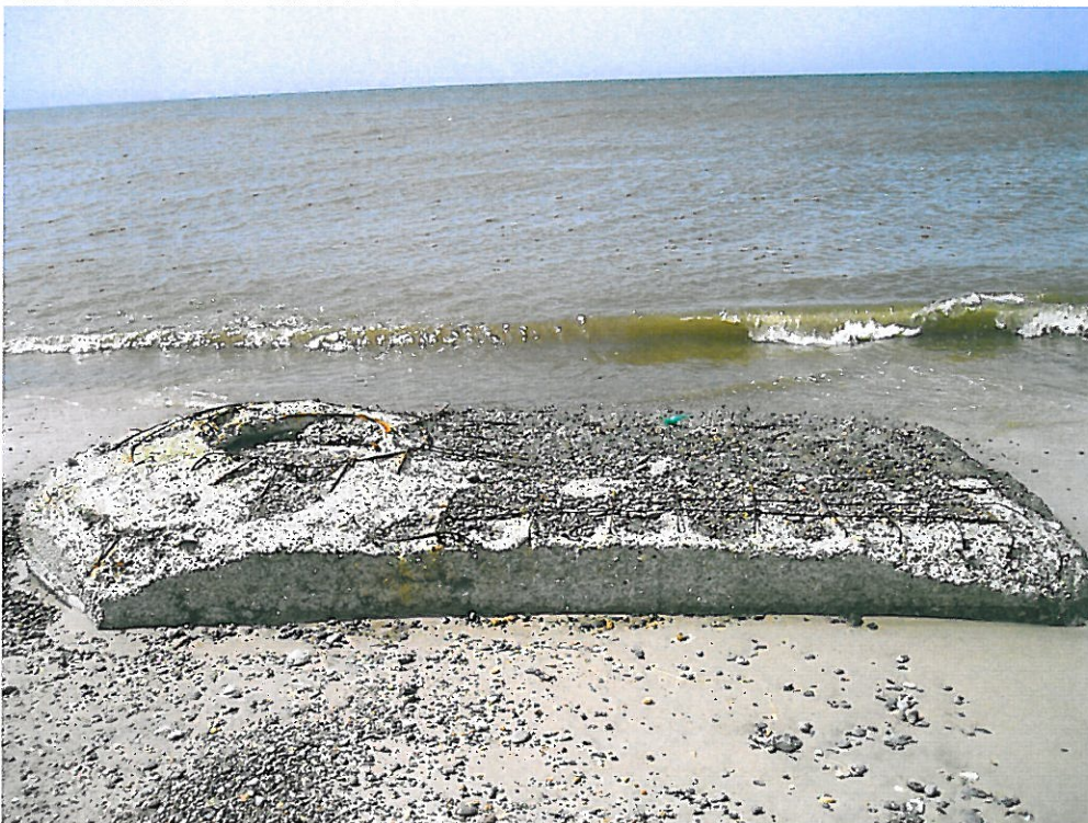
En tredje bunker ved -60, som ligger længere ude. Piggene har længde fra 5-6 cm og op til 60 cm