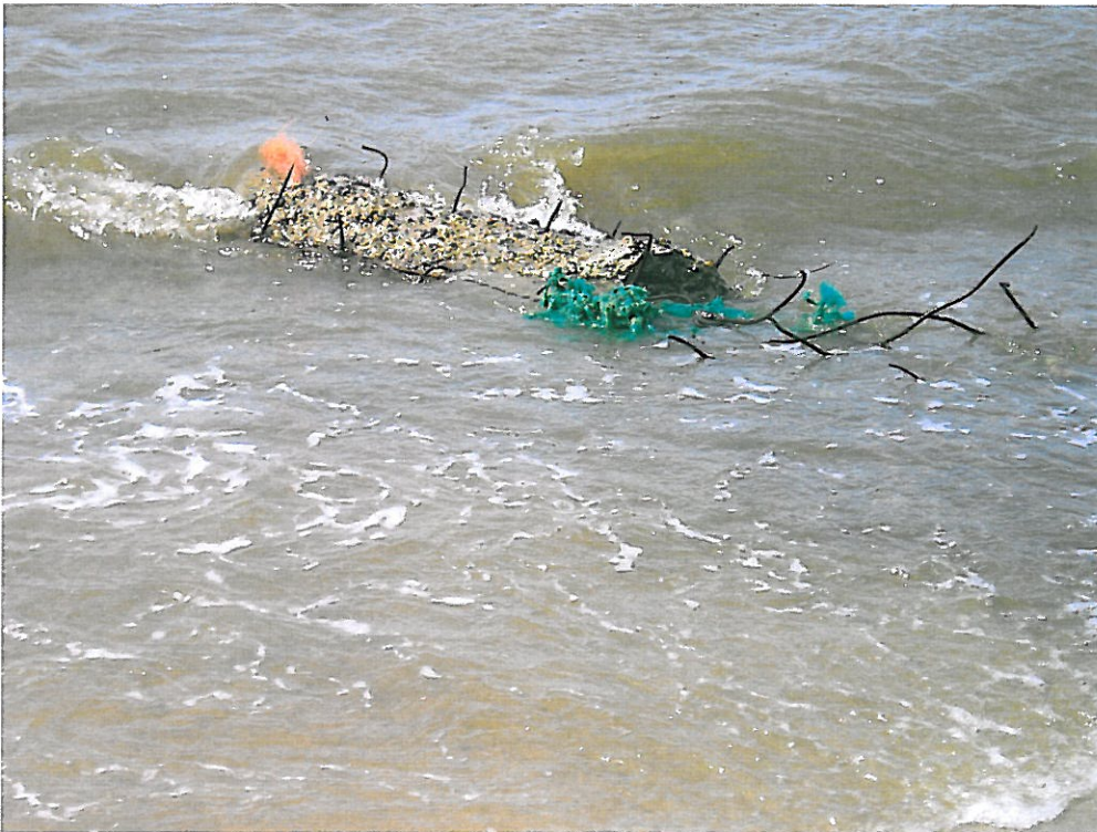
En anden bunker ved vandstand -60