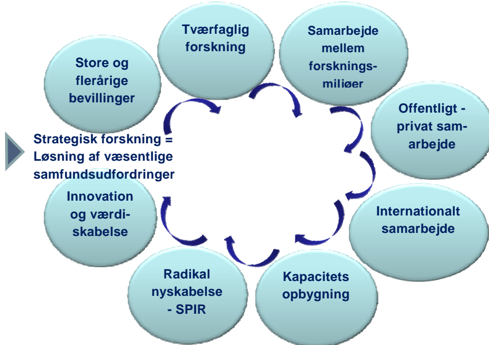
Figur: Det Strategiske Forskningsråds særlige kendetegn