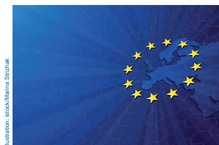
Illustration: isrock/Marina Shtrzhak