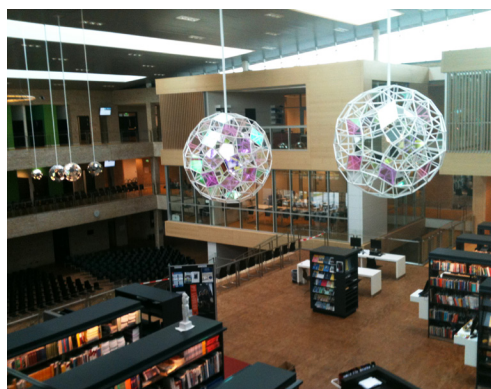
Bibliotek og aula på A.P. Møller Skolen i Slesvig