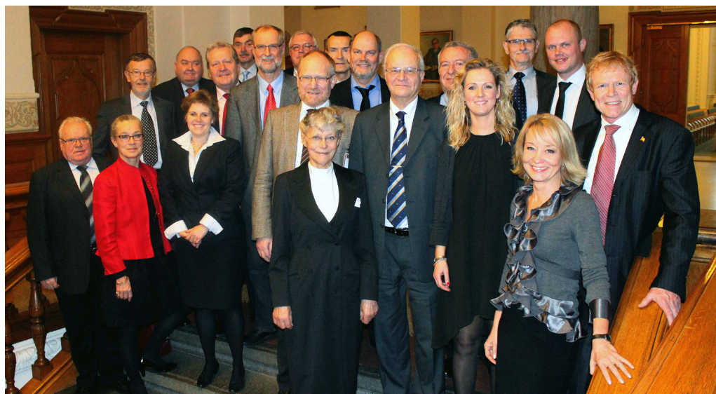
Gruppebillede med tidligere og nuværende statsrevisorer, rigsrevisor og Statsrevisorernes Sekretariat

I anledning af jubilæet bragte Jyllands Posten den 8. februar 2011 en kronik med titlen: