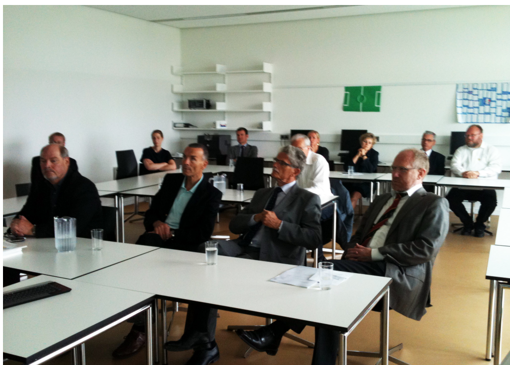
Statsrevisorerne på besøg på A.P. Møller Skolen

Ved besøg på stedet ønsker Statsrevisorerne at se institutioner, realiserede og igangværende projekter samt møde relevante medarbejdere og samarbejdspartnere for at få indtryk af de forskellige aktiviteter og de betingelser, hvorunder statslig virksomhed bliver udført.