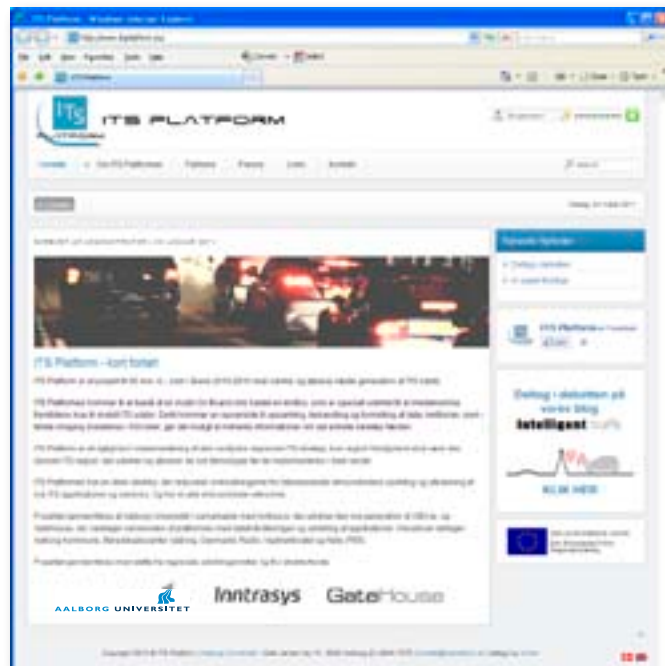
www.itsplatform.eu er en åben platform for applikationer, som hjælper bilisterne.