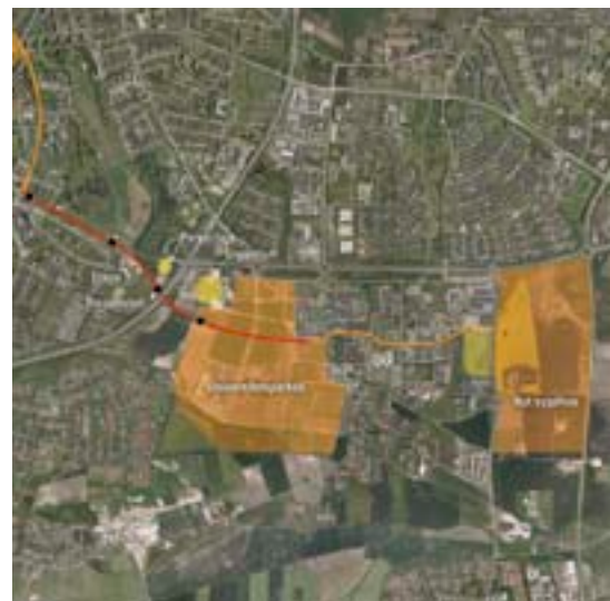
Busvejen parallelt med Universitetsboulevarden styrker den kollektive trafik i universitetskorridoren.