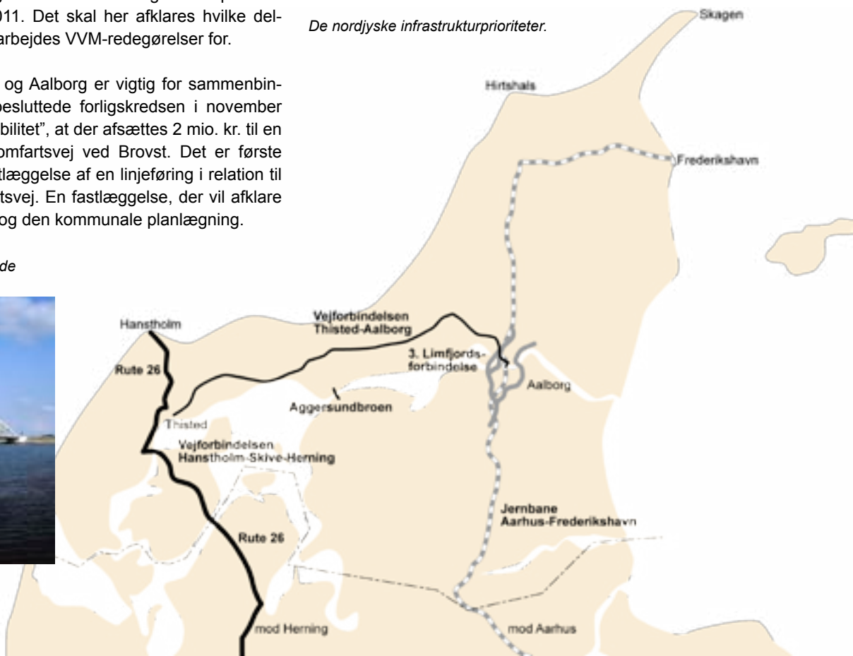
De nordjyske infrastrukturprioriteter.