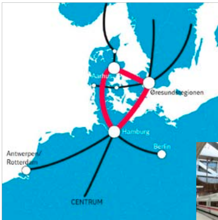
En mulig vision for stærke transportforbindelser.