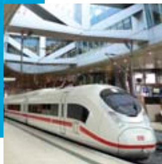
I den samfundsøkonomiske analyse af en fast Kattegatforbindelse er der taget udgangspunkt i tog af tysk ICE standard, der kan køre 300 km/t.