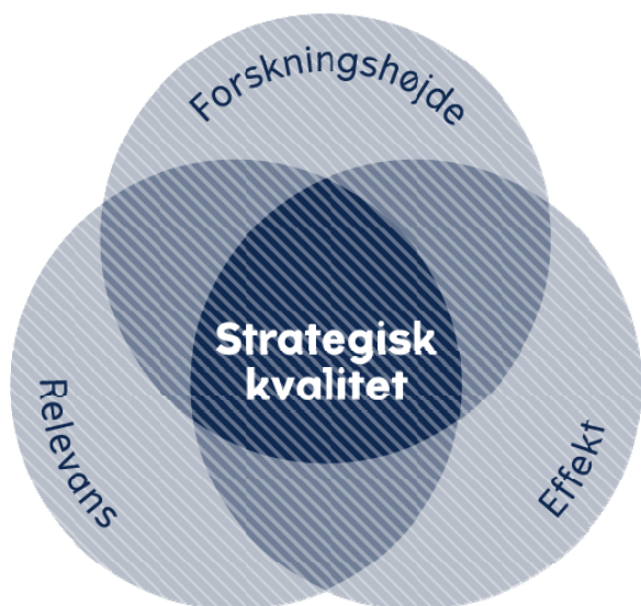
Figur: Det Strategiske Forskningsråds kvalitetsbegreb

Relevans vurderes ud fra forskningsemnets overensstemmelse med de samfundsmæssige udfordringer, der danner grundlag for det pågældende forsknings-tema.