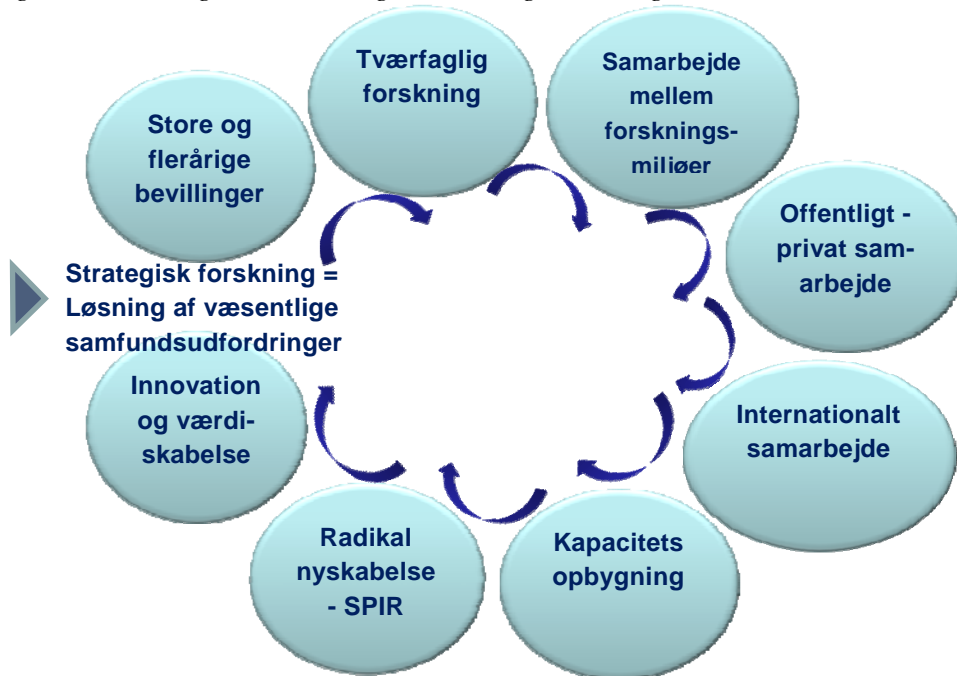
Figur: Det Strategiske Forskningsråds særlige kendetegn