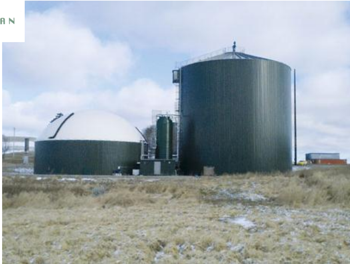
Synergy – Biogasanlæg - Vinteren 2011/12 Det største biogasanlæg i staten NY, USA