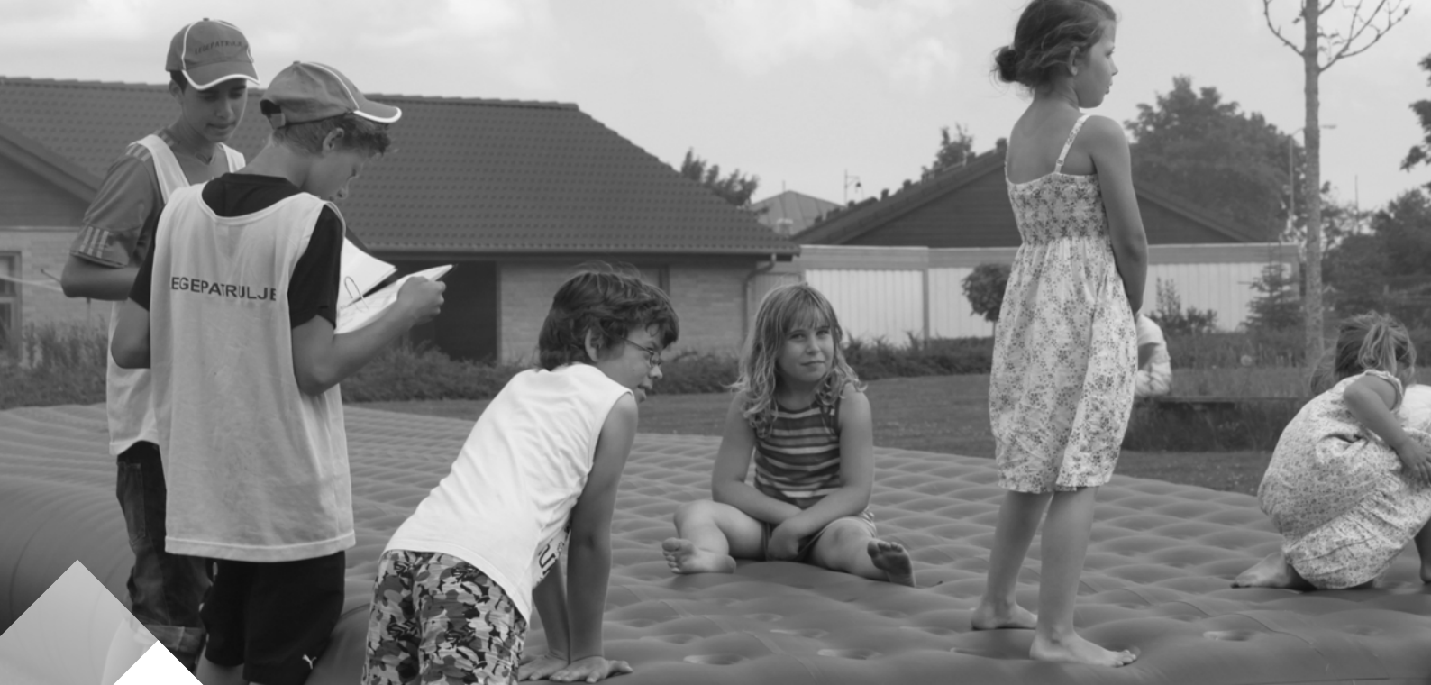
Begge sider: Legepatruljen bidrager til børnelivet i boligområdet ved at organisere lege for områdets børn.