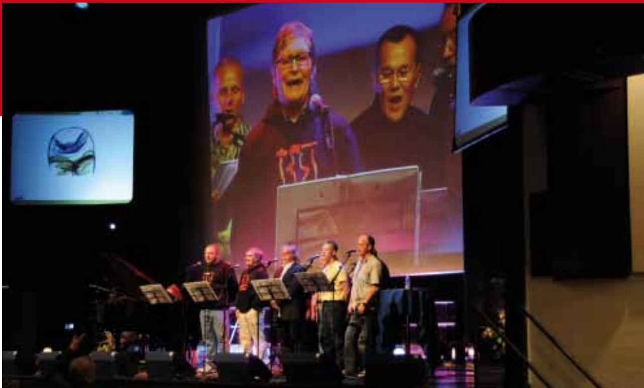
Fangekoret optrådte for mere end 1000 begejstrede tilhørere på Danske Kirkedage i 2010.