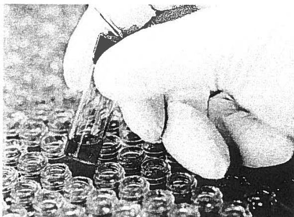
Nå registreres også hverdagskriminaliteten inn i DNA-banken.

DNA-reformen innebærer en av de store reformene i strafferettspleien, og formålet er en mer effektiv etterforskning og økt oppklaring, både med tanke på den kriminaliteten som rammer folk flest og mer alvorlig kriminalitet. Satsingen medfører langt flere person og sporprøver til analyse. Politidistriktenes kapasitet og kompetanse til sikring av DNA-spor fra åsteder er styrket som en del av reformen.