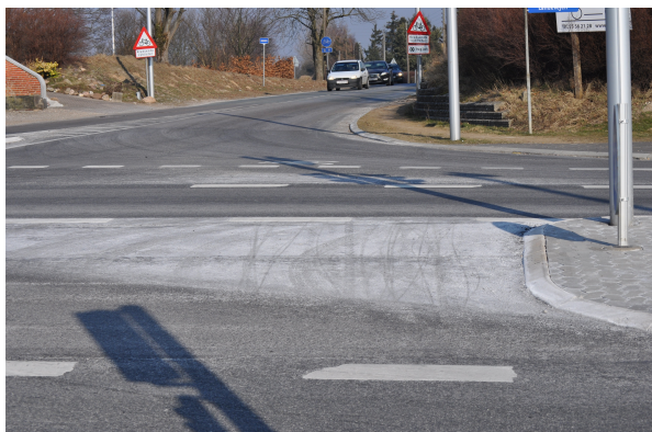
Den afkortede helle på primærvejen