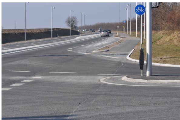
Den afkortede helle i sidevejen