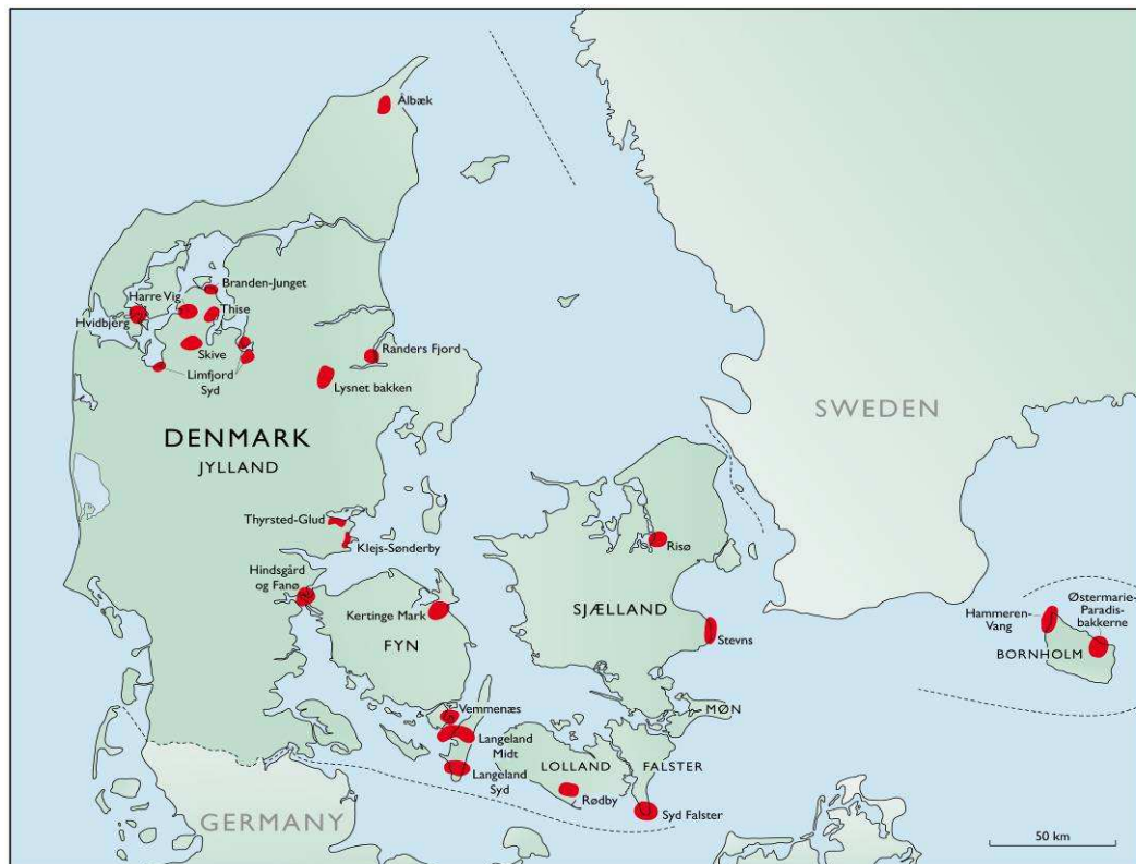
Fig.1. Beliggenhed af de 22 potentielle områder.

Der er indenfor de 22 områder tale om følgende bjergarter og/eller sedimenter af forskellig geologisk alder (Fig. 2), som alle er dækket af forskellige tykkelser af moræneler: