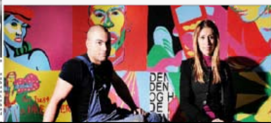
Rollemodellerne besøgte TV2 København, og talte om deres rolle i integrationen. De har taget ud til Høstebro og mødt rollemodellerne i Høstebro.