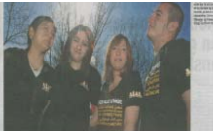
Rollemodeller besøger Høstebro For mange unge med indvandringsbaggrund blev det en stor succes at komme til Høstebro og møde rollemodellerne. De har taget ud til Høstebro og mødt rollemodellerne i Høstebro. De har taget ud til Høstebro og mødt rollemodellerne i Høstebro.