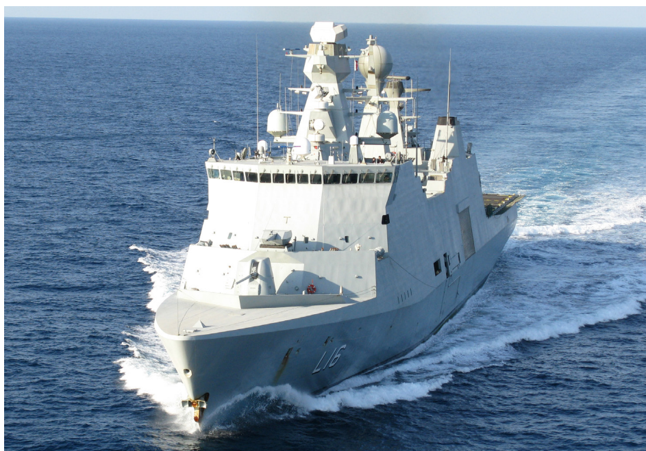
Det danske skib Absalon.

nem resolutionerne 1851 (2008), 1897 (2009), 1950 (2010) og 1976 (2011) sat rammerne for de internationale bestræ-