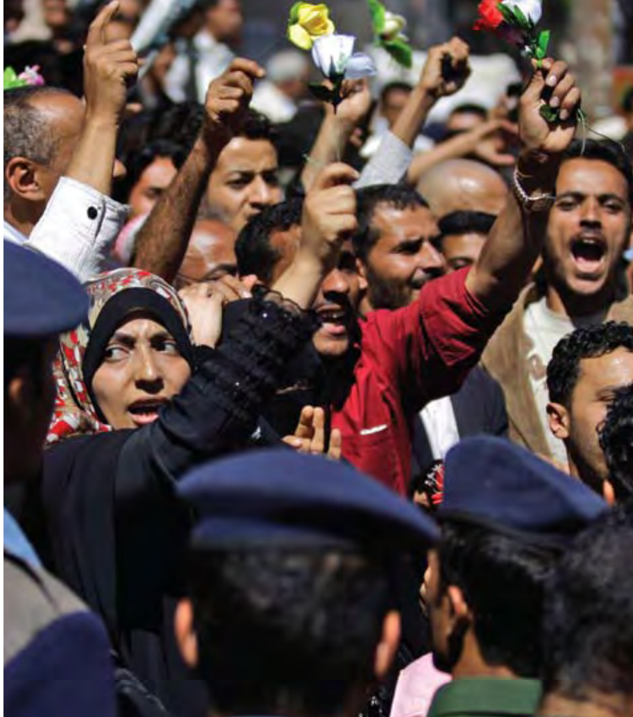
AKTIVISTEN TAWAKAL KARMAN VED DEMONSTRATION I SANA'A, YEMEN.