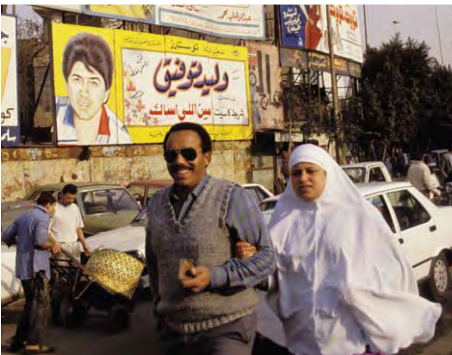
CAIRO, EGYPTEN.