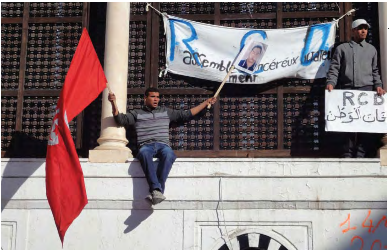
DEMONSTRATION FORAN STATSMINISTERIET, TUNIS, TUNESIEN.

Temaet ”frihedsrettigheder og god regeringsførelse” retter sig mod at sikre de borgerlige frihedsrettigheder – herunder politiske rettigheder – samt at sikre en velfungerende og transparent administration, der garanterer borgernes retssikkerhed. Under Partnerskab for Dialog og Reform fokuseres indsatsen inden for dette tema på områderne menneskerettigheder i Mellemøsten, arbejdsmarkedsreformer, unges samfundsdeltagelse samt god regeringsførelse . Inden for området menneskerettigheder støttes tre regionale projekter, et torturforebyggende projekt i Jordan samt et projekt i Yemen med fokus på strafferet. Et trepartssamarbejde om social dialog i Marokko udgør indsatsen i forhold til arbejdsmarkedsreformer. Indsatsen inden for unges samfundsdeltagelse består af to større regionale programmer og mindre projekter i Yemen og Jordan. Endeligt støttes to projekter under temaet god regeringsførelse i Jordan og Yemen om henholdsvis decentralisering og parlamentssamarbejde.