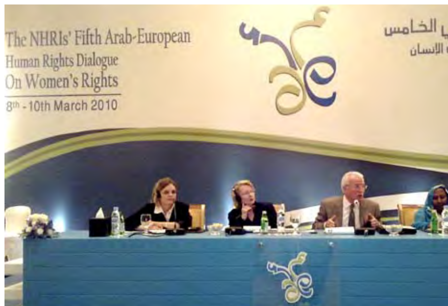
DIALOGKONFERENCE OM KVINDERS RETTIGHEDER OG LIGESTILLING, HAAG, HOLLAND.

Projektets overordnede målsætning er at bidrage til bedre forudsætninger for, at menneskerettighederne bliver respekteret i Mellemøsten og Europa samt at øge bevidstheden om menneskerettighedsproblemer i begge regioner. I projektet samarbejder 14 nationale menneskerettighedsinstitutioner gennem et arabisk-europæisk forum om tre centrale målsætninger: