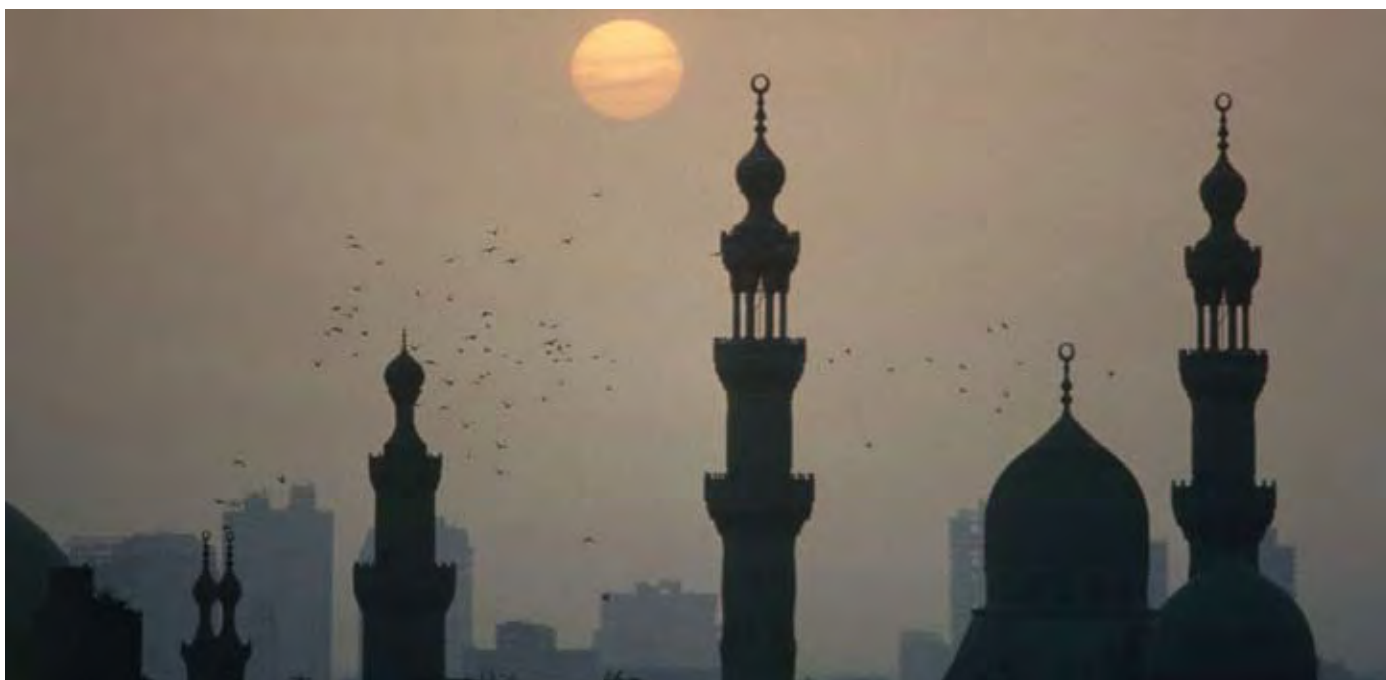
MOSKÉ MED MINARET I CAIRO, EGYPTEN.

I forbindelse med lanceringen af Det Arabiske Initiativ i 2003 anmodede det egyptiske kulturministerium Danmark om at bidrage til etableringen af en filial af Misr Public Library (MPL) i en fattig bydel i det nordøstlige Kairo. Kvarteret er et lavindkomstområde befolket af 2 mio. egyptere, hvoraf størstedelen er unge (42 procent er under 15 år) og ca. 30 procent af befolkningen over 15 år er analfabeter. Der eksisterer intet bibliotek i området og åbningen af en filial forventes at give området et generelt socialt løft. Især i forhold til børn og unge, der vil få et tiltrængt kulturelt og socialt samlingssted, adgang til bøger, tidsskrifter og internet samt plads og ro til lektielæsning. MPL består i forvejen af et hovedbibliotek og to filialer i Cairo samt biblioteker i yderligere to andre byer. Etablering af MPL-filialen er en del af en langsigtet indsats for at højne befolkningens læsefærdigheder.