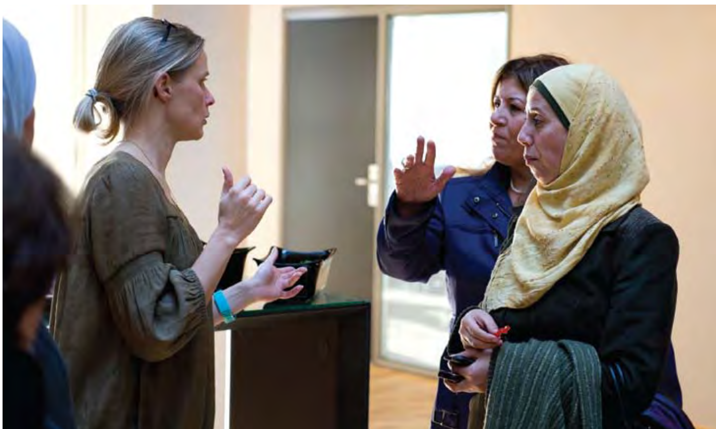
KVINDEKONFERENCEN I KØBENHAVN.