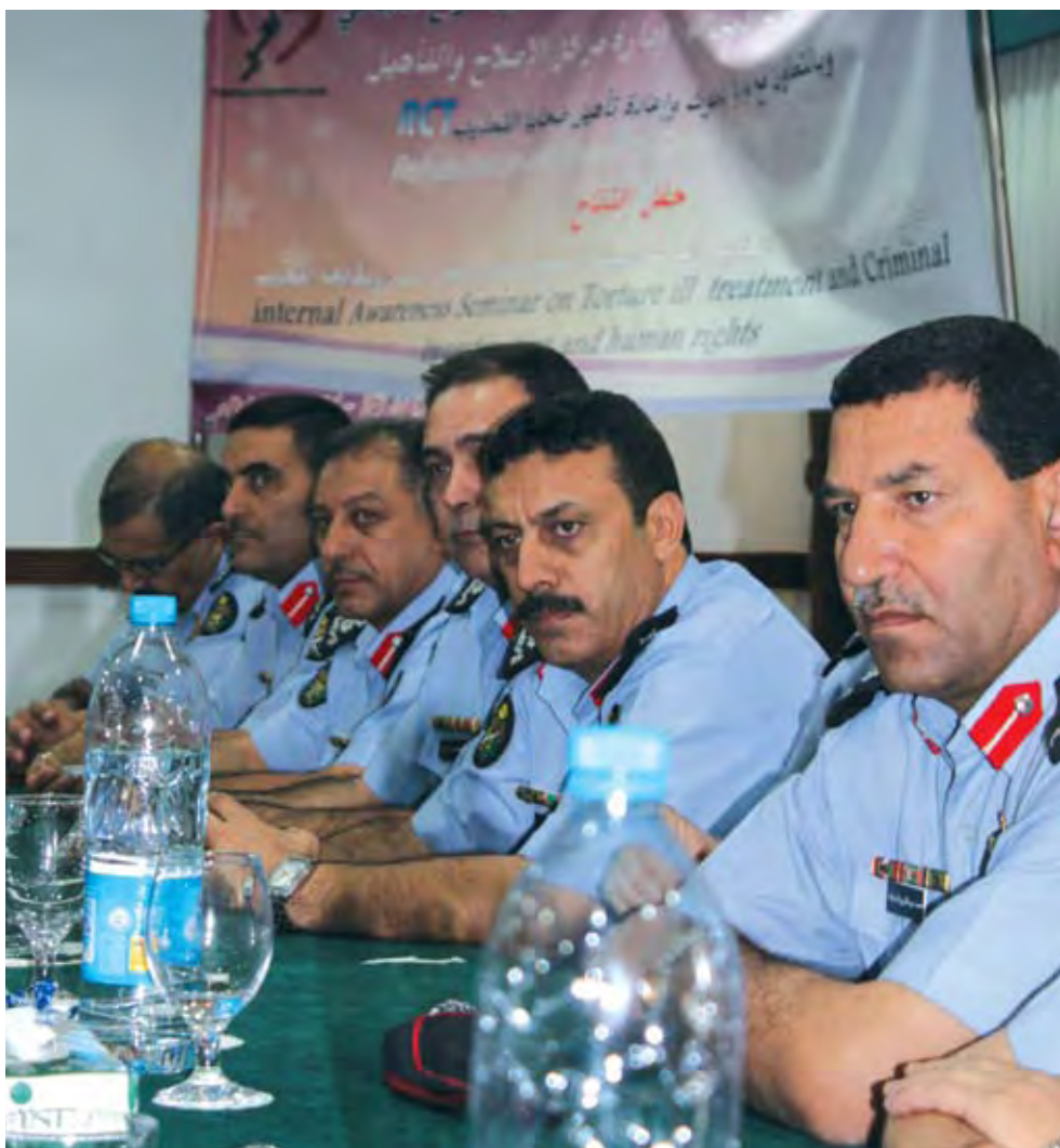
TRÆNING AF POLITIOFFICERER I JORDAN.