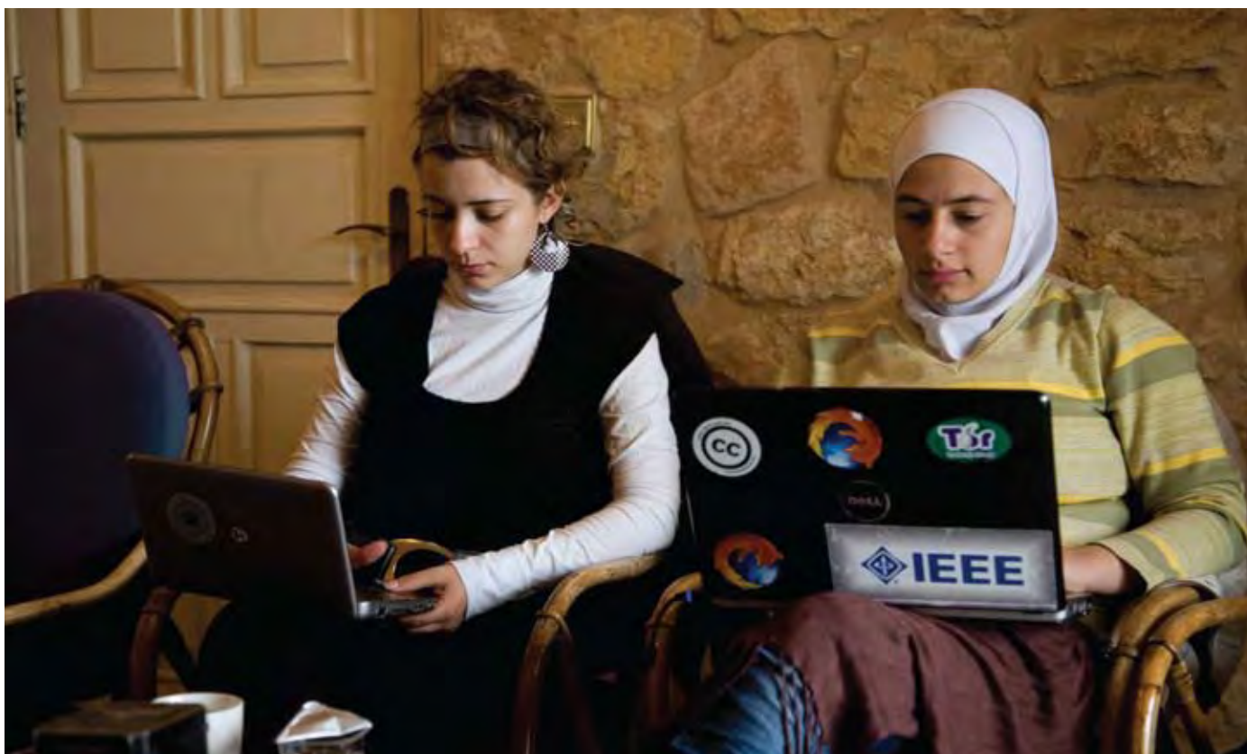
KVINDELIGE BLOGGERE PÅ WORKSHOP I JORDAN.