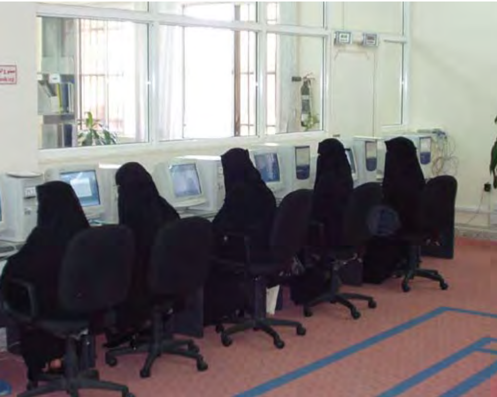
INERTET CAFÉ, YEMEN.