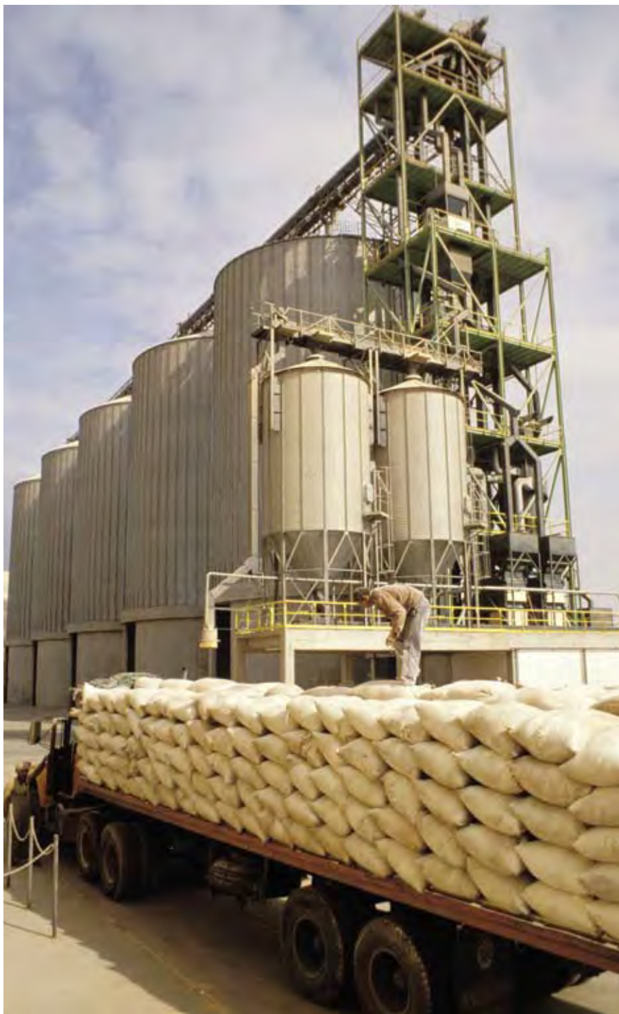
KORNSILO, EGYPTEN.