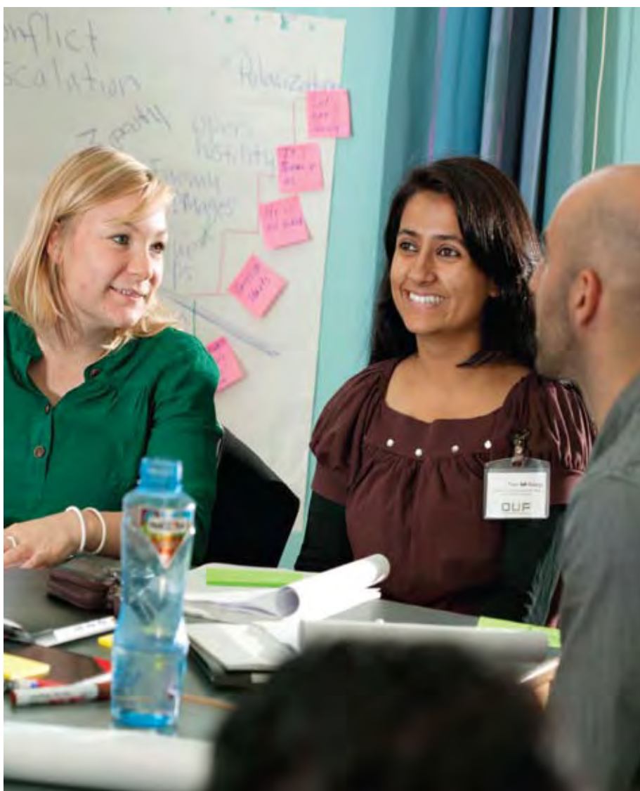
UNGDOMSLEDERKURSUS, KØBENHAVN.