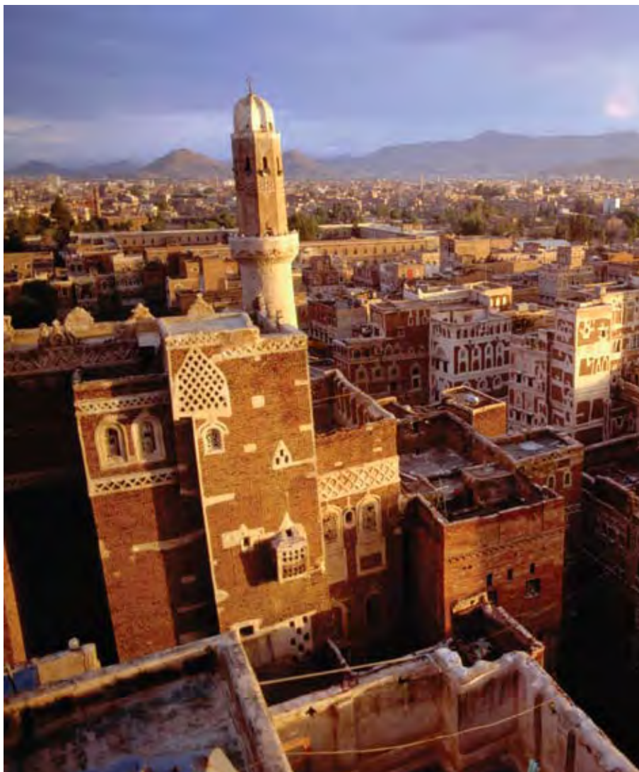
SANA'A, YEMEN.

Der er i samarbejde med en række centrale borgmestre udarbejdet konkrete forslag til procedurer og formålsbeskrivelse for etableringen af en jordansk kommuneforening, der kan anvendes i jordanske borgmestres lobbyarbejde for at få tilladelse til at etablere en kommunesammenslutning, som kan varetage kommunernes interesse i forhold til centralregeringen.