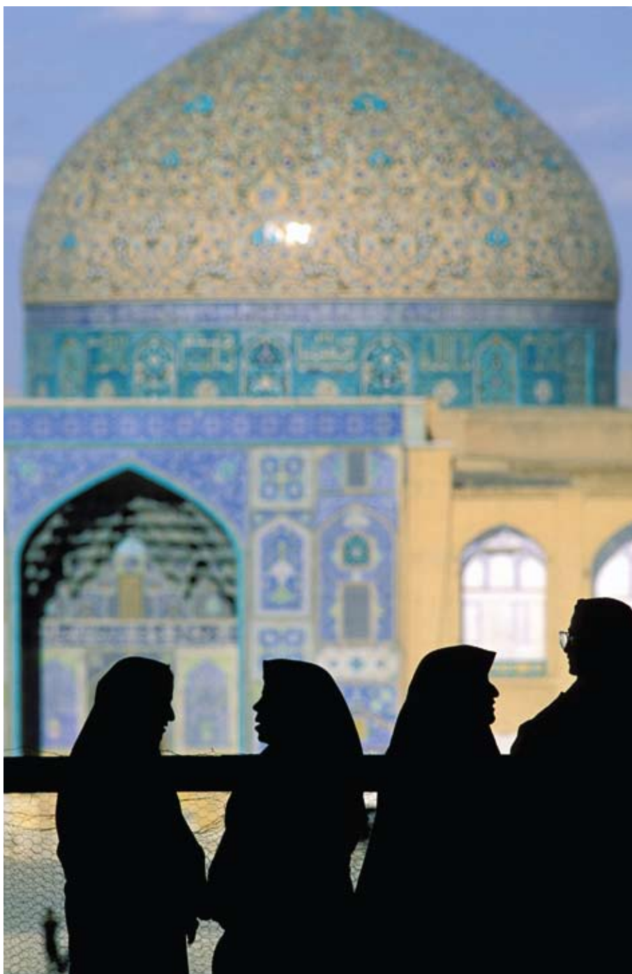
LOTFOLLAH MOSKÉ I ESFAHAN, IRAN.

Siden Partnerskab for Dialog og Reform blev lanceret, har kvinders rettigheder været et centralt indsatsområde. KVINFO er ansvarlig for det overordnede regionale program om kvinderettigheder og gennemfører desuden bilaterale projekter i Marokko og Jordan. Red Barnet arbejder med et program i Jordan og den britiske organisation Oxfam arbejder med et projekt i Yemen. Det er KVINFOs ansvar at koordinere involveringen af danske aktører bredt og formidle kontakter mellem disse og tilsvarende institutioner og organisationer i Mellemøsten. Det regionale program implementeres i tæt samarbejde med de bilaterale indsatser for at sikre, at erfaringerne samles og formidles til relevante aktører i både Mellemøsten og Danmark, og støtter desuden op omkring netværksdannelse på tværs af regionen. Samtidig afprøves og testes nye metoder og temaer under det regionale program, som siden kan tages op i mere fokuserede bilaterale indsatser.