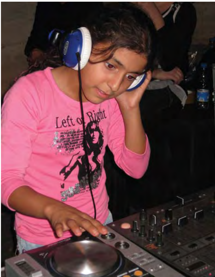
DJ-WORKSHOP I BEIRUT, LIBANON.