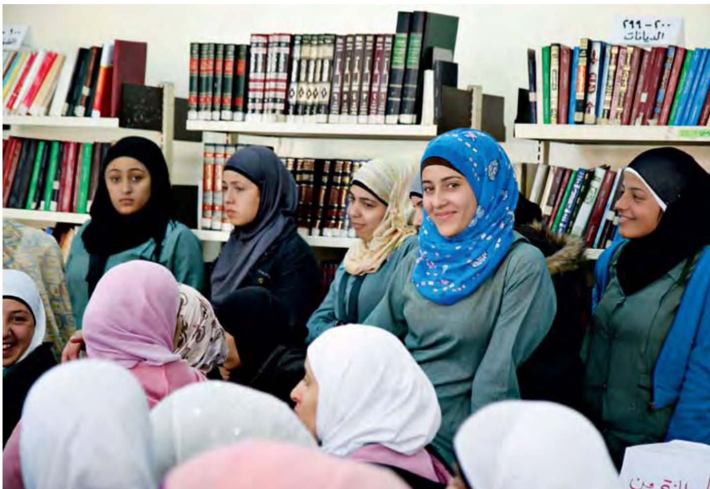
TRÆNING AF KVINDelige POLITIBETJENTE OG SOCIALARBEJDERE, AMMAN, JORDAN.

4) Støtte Family Protection Departments samarbejde med andre arabiske lande om etablering af lig- nende services og forbyggende arbejde på familiebeskyttelsesområdet.