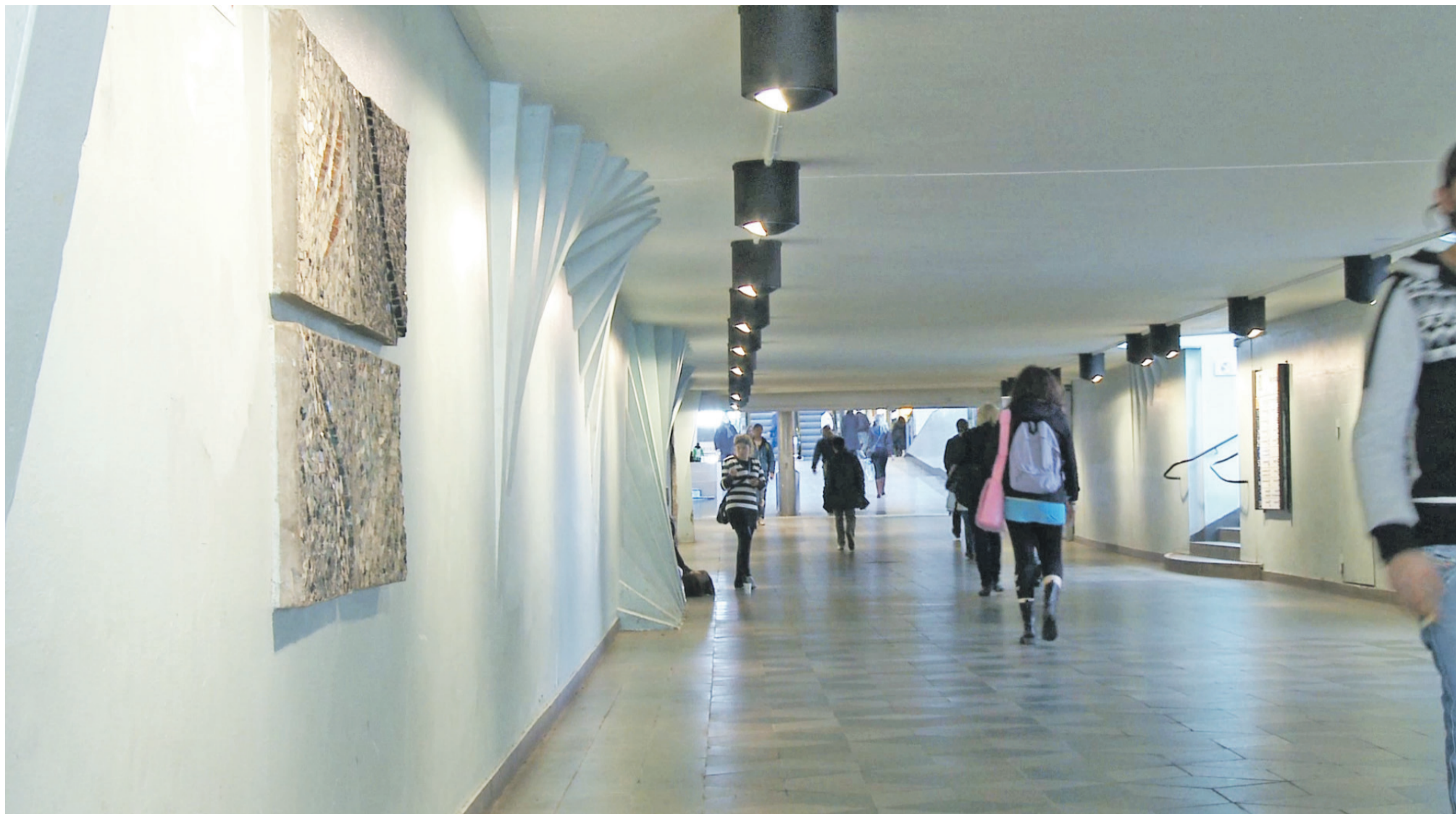
Tunnelen, der forbinder Centralstationen i Göteborg med det nærliggende butikscener, er lys og luftig og passeres dagligt af flere hundrede tusinder fodgængere.