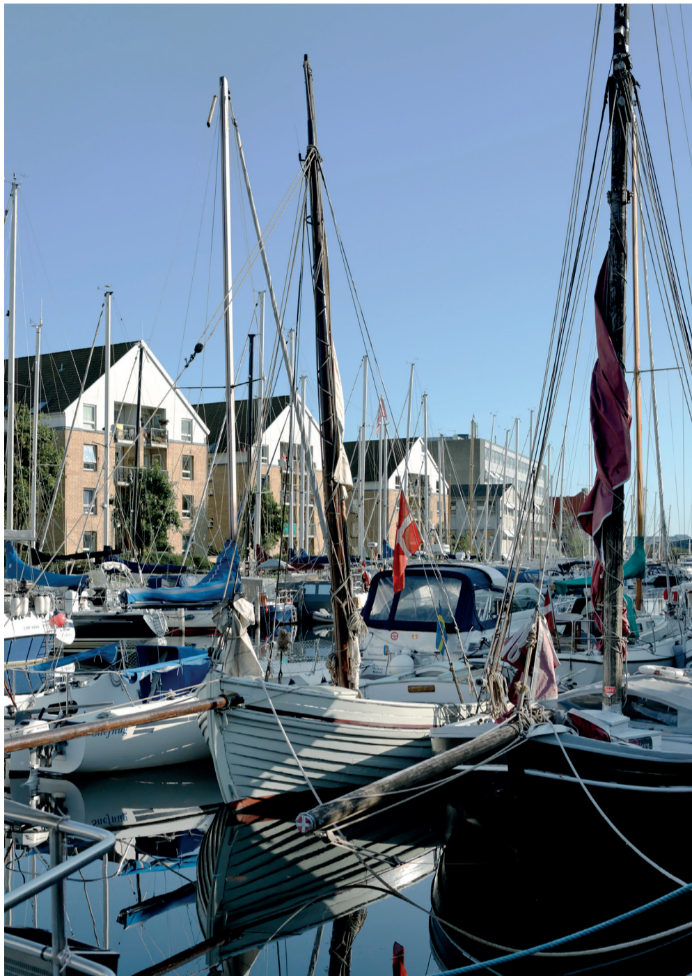
Sejlskibsmiljø med lugt af tjære og saltvand præger kanalen som det har gjort i 400 år. Men bygges broerne, er det slut.