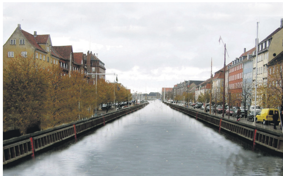
Dette kan blive tæt på virkeligheden, hvis Københavns Kommune får gennemført broer over kanalerne. Sejlerne vil finde andre fortøjningspladser, og livet på kajen vil svinde ind, hvis der ikke længere sker noget på vandet. Montage: Henning Larsen.

Se indslag om havnen på www.christianshavnskvarter.dk