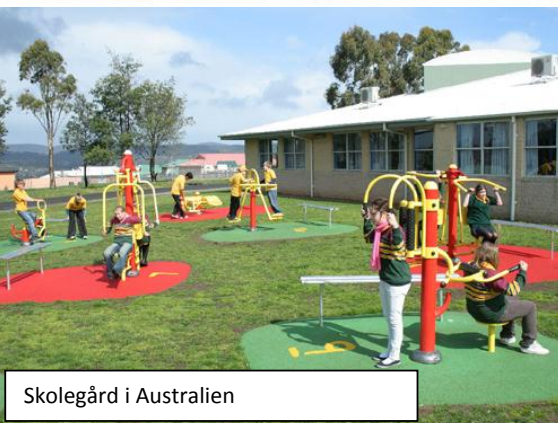
Skolegård i Australien

Kilde: WHO Sundhed for alle Strategi 2000.