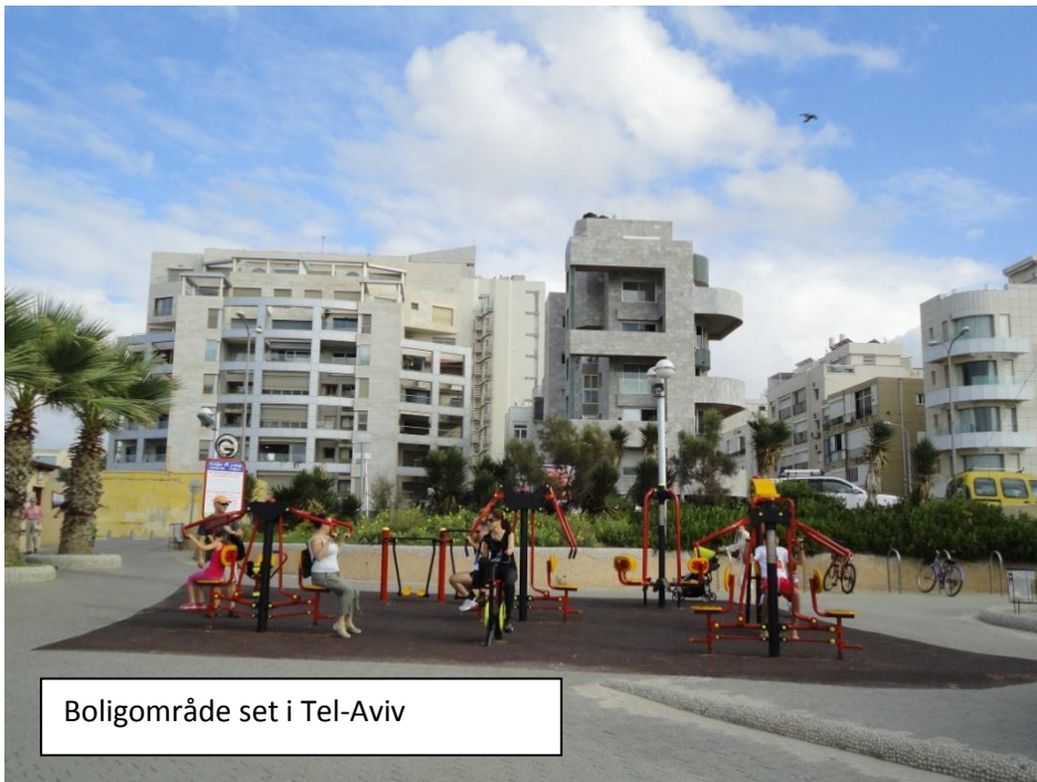
Boligområde set i Tel-Aviv