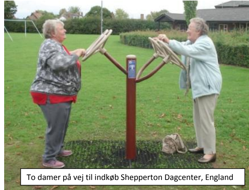
To damer på vej til indkøb Shepperton Dagcenter, England