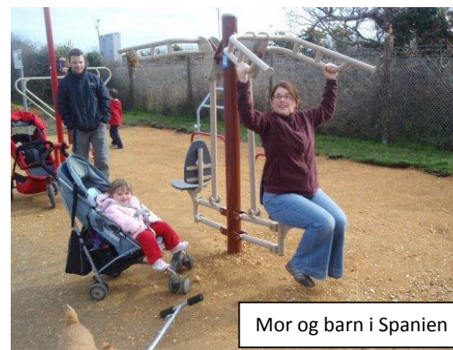
Mor og barn i Spanien