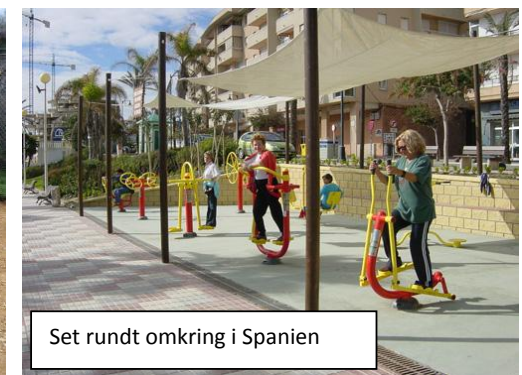
Set rundt omkring i Spanien