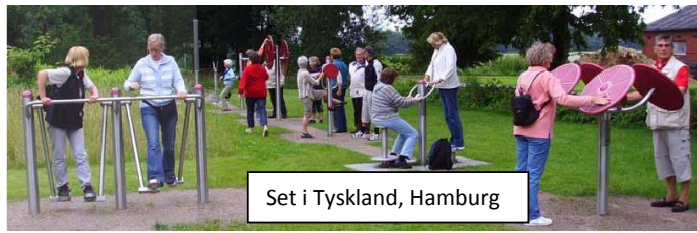
Set i Tyskland, Hamburg

Den sunde by Dokumentation af de faktorer, som påvirker sundhed i den tætte by og forstaden som led i udvikling af bæredygtig planlægning som praktiseres rundt omkring i verden.