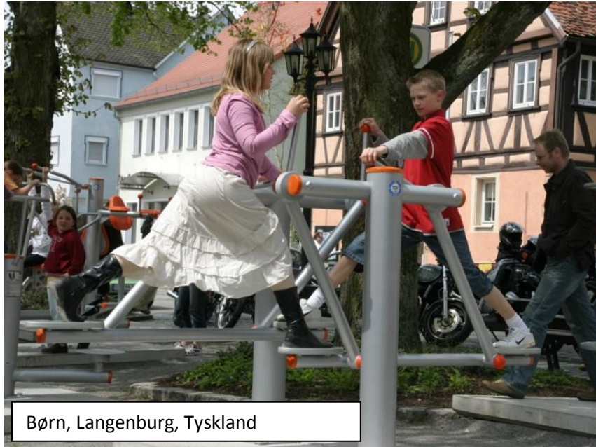
Børn, Langenburg, Tyskland