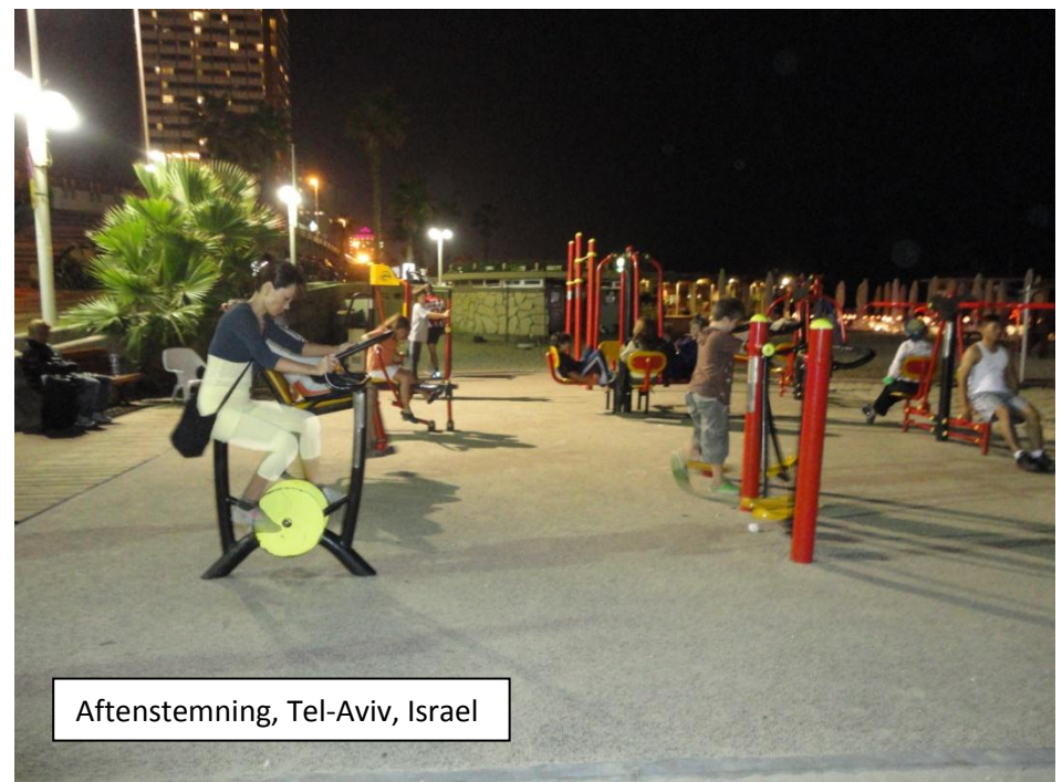
Aftenstemning, Tel-Aviv, Israel