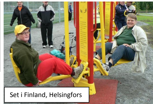
Set i Finland, Helsingfors