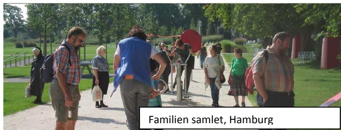
Familien samlet, Hamburg