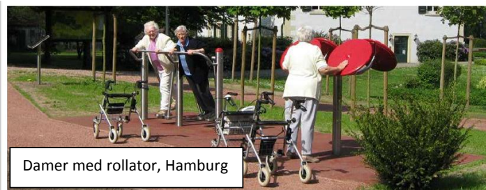
Damer med rollator, Hamburg