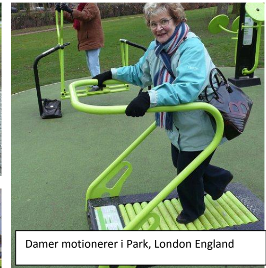
Damer motionerer i Park, London England