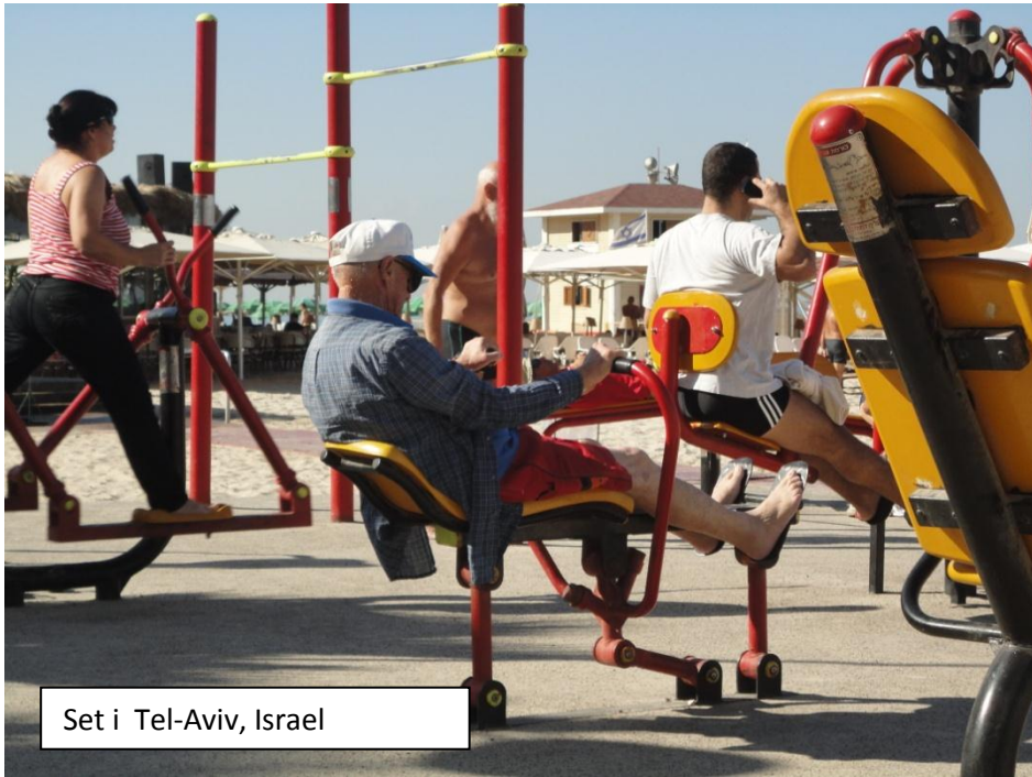
Set i Tel-Aviv, Israel