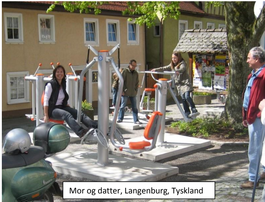
Mor og datter, Langenburg, Tyskland