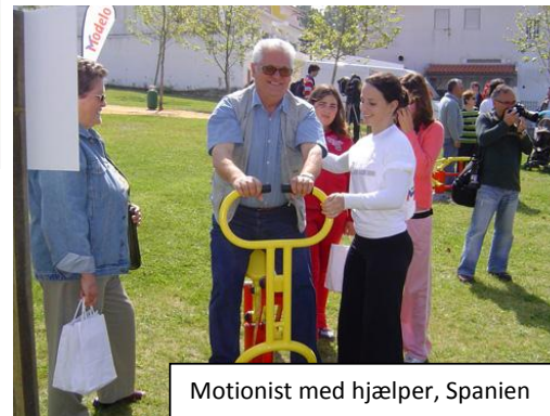
Motionist med hjælper, Spanien