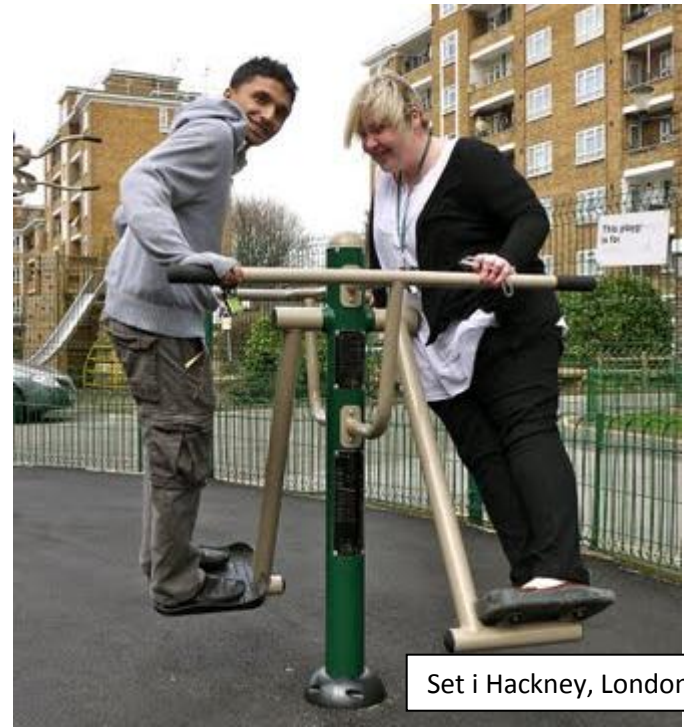
Set i Hackney, London