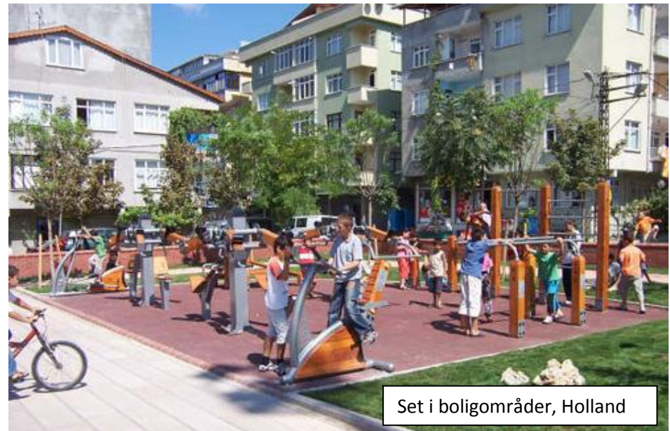
Set i boligområder, Holland