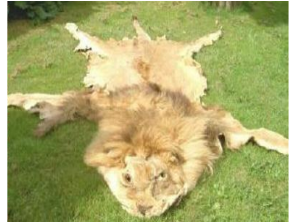
Manden efter bruddet

Du ser den udstødte mand på gaden hver dag