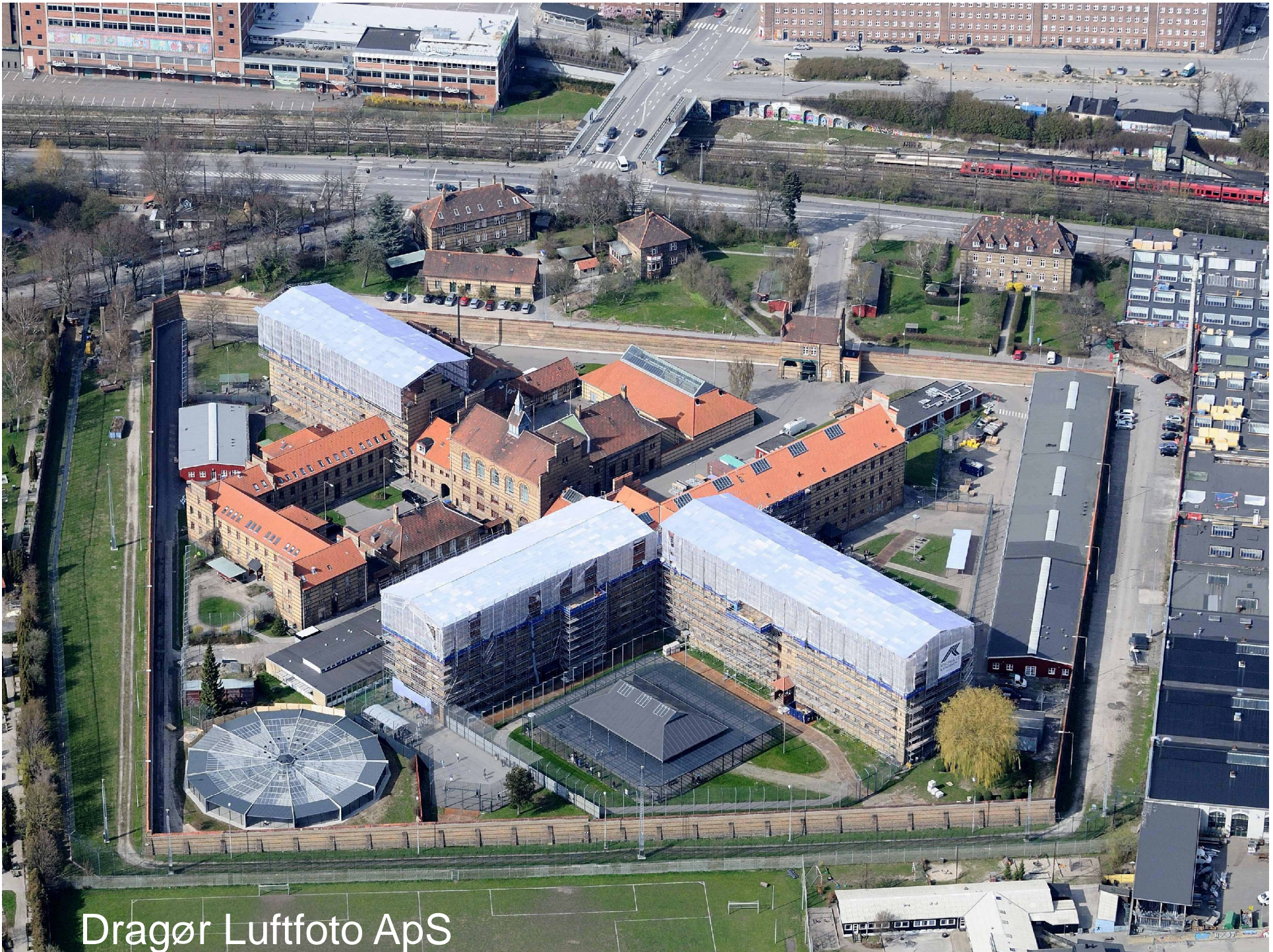
Dragør Luftfoto ApS