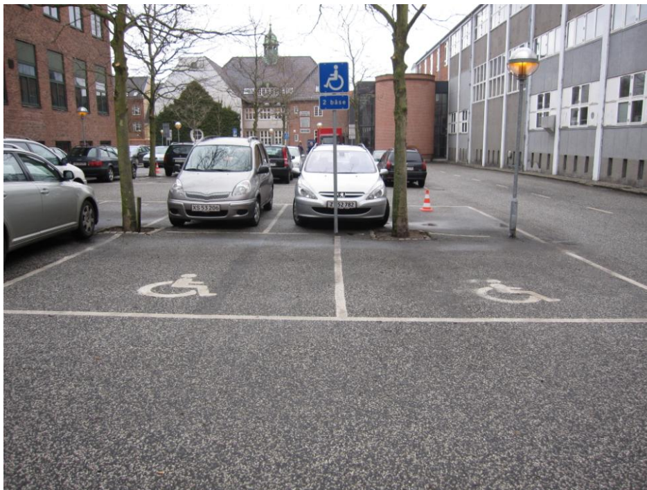
Illustration 1 – Handicapparkeringspladser ved indkørsel fra Boulevarden

Der er to forskellige steder på parkeringspladsen indrettet handicapparkering: I et hjørne umiddelbart uden for en af de to indgange til Borgerservice (en enkelt plads) og midt på parkeringspladsen tættest på indkørslen fra Boulevarden (to pladser). Den førstnævnte plads er placeret i hjørnet for enden af den række der starter ved indkørslen til parkeringspladsen fra Rantzausgade, og de to sidstnævnte pladser er placeret i anden række regnet fra indkørslen fra Boulevarden.