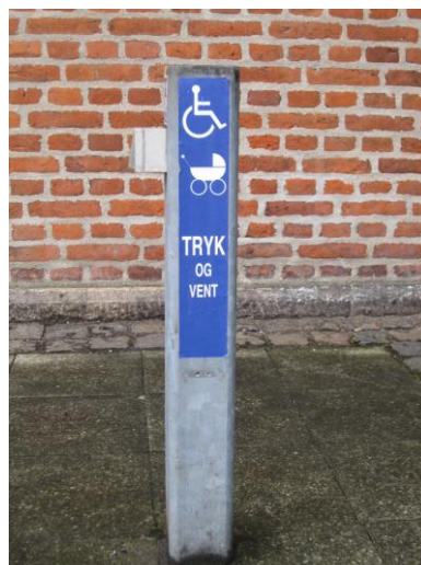
Illustration 8 – Ringeklokke til Borgerservice

Lige uden for indgangsdøren er der en tydelig knap i en god højde til åbning af dørene. Som det fremgår af nedenstående illustration er knappen forsynet med et pikto-gram der viser kørestole/barnevogne.