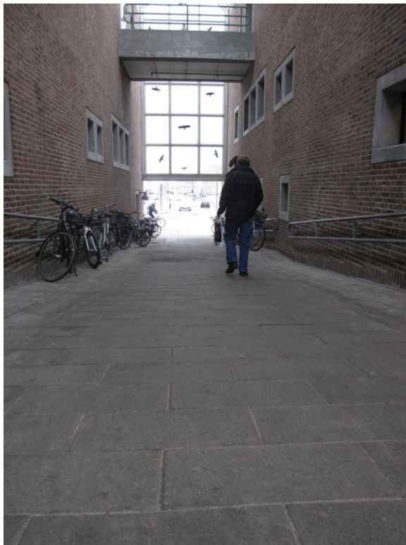
Illustration 17 – Rampe fra Medborgerhuset ned mod parkeringsanlægget ved havnen

Adgangen fra den modsatte side (havnesiden) synes i modsætning til adgangen fra gågaden at være vanskeligere at benytte for kørestolsbrugere. Jeg sigter hermed til hældningsgraden.