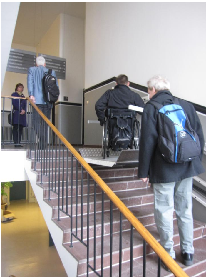
Illustration 3 – Trappelift op til stueetagen

En af mine medarbejdere bemærkede under afprøvningen at den faste kant på den yderste del af løfteplatformen fra indgangsdøren op til stueetagen er løsnet således at kanten, når trappeliften ikke er parkeret, vender nedad og således ikke opfylder sit formål (at forhindre at det yderste hjul på kørestolen kan bevæge sig ud over platformens kant).