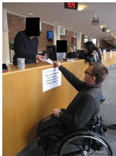
Illustration 12 – SKAT's skranke

Skranken som hører til SKAT, er ekstraordinær høj (119 cm).