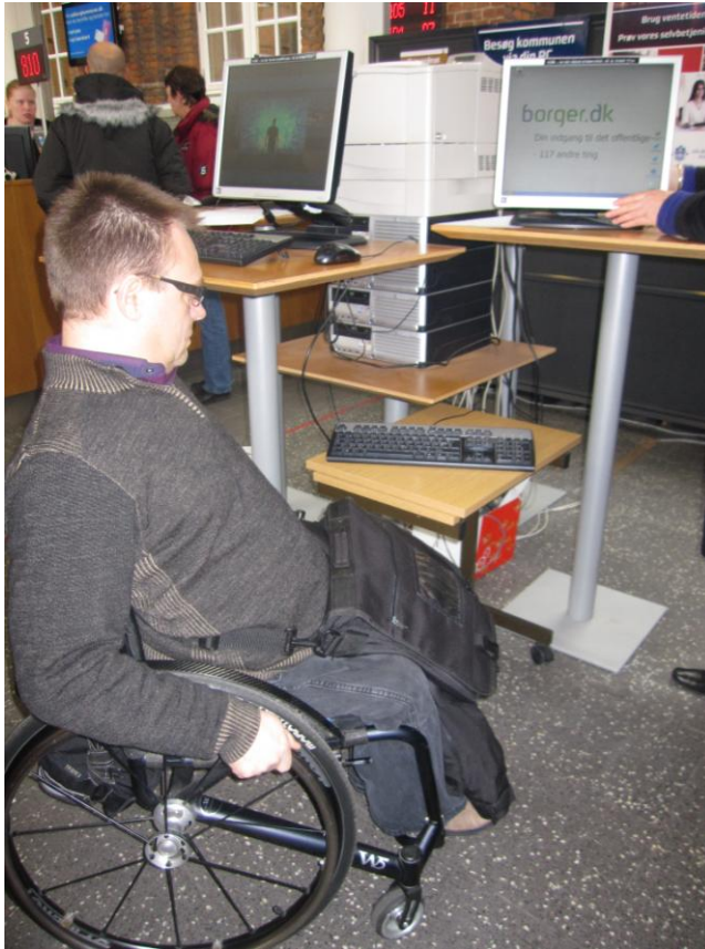
Illustration 14 – Ikke-højdejusterbart EDB-bord

Der var cirka midt i lokalet et edb-bord på en søjle. Det viste sig under inspektionen at det ikke var muligt at variere højden på bordet. Med et vist besvær lykkedes det at få tastaturet placeret i en passende højde for en kørestolsbruger således som det også fremgår af illustrationen nedenfor.