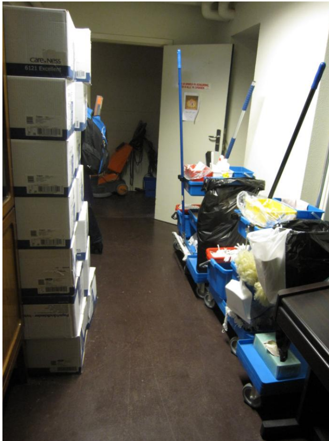
Illustration 5 – Adgangsvej til handicaptollet

Indgangen til handicaptollet opnås gennem et rengøringsrum. På tidspunktet for inspektionen var der – udover rengøringsvogne – placeret et elklaver og et større parti printerpapir i rengøringsrummet.