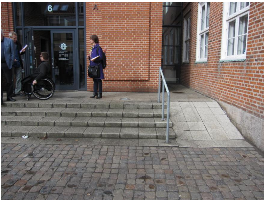
Illustration 10 – Indgangsparti i Rantzausgade (for barnevogne)

Adgangen fra Rantzausgade nås ved en bred trappe med fire trin der er forsynet med håndlister i begge sider. Ligeledes på begge sider af trappen er der en relativ bred opkørsel (godt 1,5 m bred) belagt med store kvadratiske fliser. Det blev under inspektionen oplyst at de to opkørsler udelukkende er beregnet til barnevogne (og ikke til kørestole).