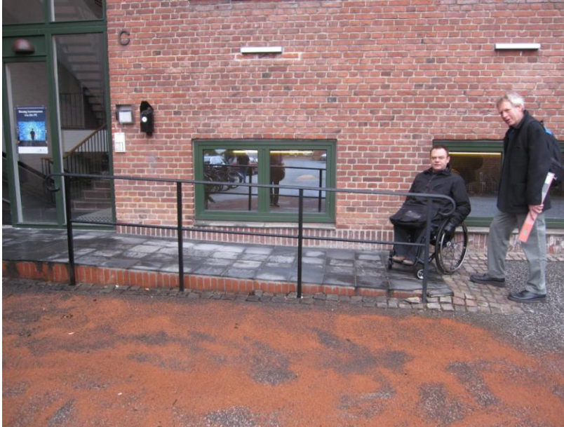
Illustration 2 – Rampe ved Indgang C

Der er ingen former for værn mod parkeringspladsen foran selve indgangspartiet, men dog langs med rampen i øvrigt. Der er imidlertid ikke hjulværn der også bruges som afviserkant for (blinde)stokke.