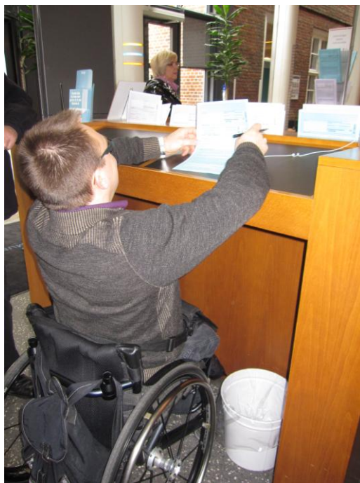
Illustration 13 – Skranke til udfyldelse af blanketter mv.

Der er forskellige steder i lokalet skranke med ansøgningsblanketter og lignende til udfyldelse i hånden.