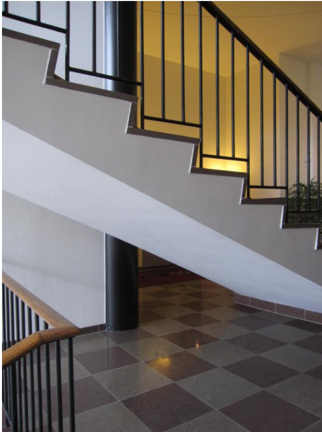
Illustration 4 – Bagsiden af trappen mellem stueetagen og 1. sal

”Af sikkerhedshensyn bør undersiden af fritstående trapper afskærmes, så uopmærksomme personer og synshandicappede ikke støder hovedet mod trappen.”