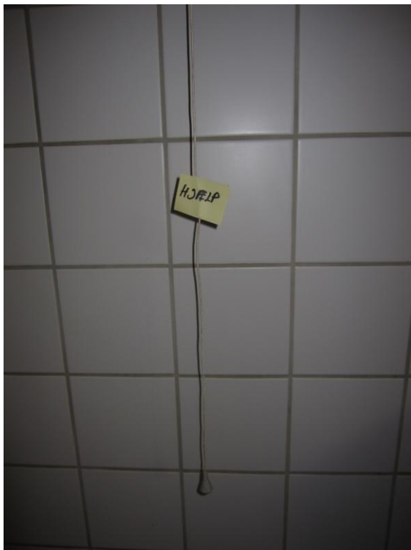
Illustration 16 - Nødkald

På toilettet er der et nødkald, hvilket jeg kun få gange har oplevet i forbindelse med tidligere tilsvarende inspektioner. Nødkaldet kan nås siddende på toilettet.