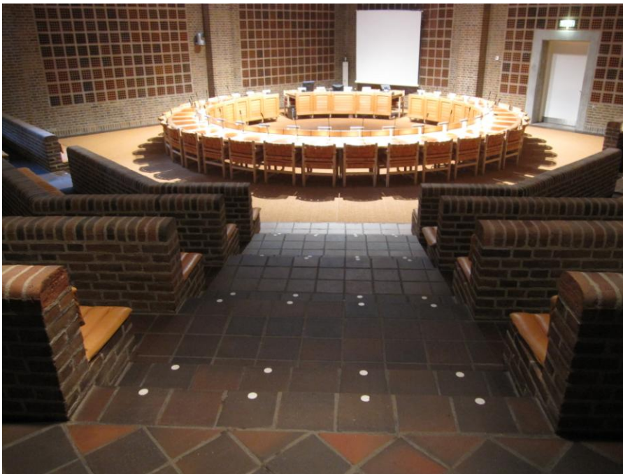
Illustration 18 - Byrådssalen

Adgangen til "gulvet" (eller "scenen") nås ad fire brede (dobbelte) trappetrin. Trinene er markeret med hvide "pletter" af hensyn til svagsynede borgere.