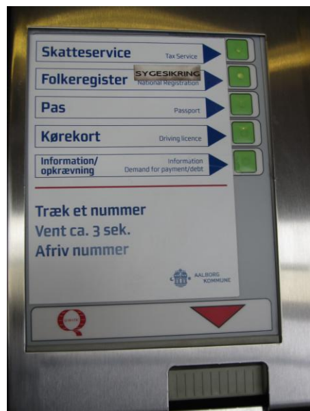
Illustration 11 - Nummersystem

Lige inden for indgangsdøren (fra parkeringspladsen) sidder nummersystemet der er placeret i en god højde også for kørestolsbrugere. Oplysningerne på tavlen er som det fremgår af illustrationen nedenfor, også på engelsk.