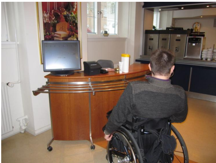
Illustration 6 - Kantinen

Bortset fra det ovenfor nævnte forhold er der efter min opfattelse gode forhold for kørestolsbrugere i kantinen. Jeg henviser bl.a. til at der er god mulighed for at komme ind til bordene fra to sider, og at højden ved betalingsskranken og ved disken/buffeten er passende.