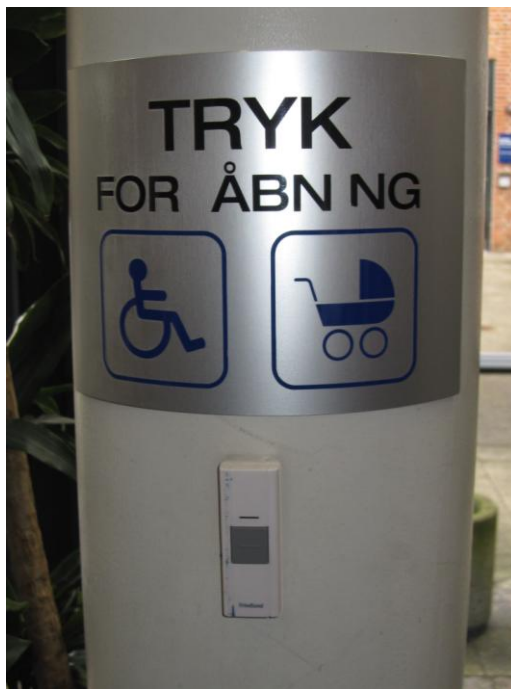
Illustration 9 – Indvendig ringeklokke/knap til døråbning

Den tilsvarende knap på den indvendige side af indgangsdøren sidder på en stolpe, og også denne er forsynet med et godt skilt.