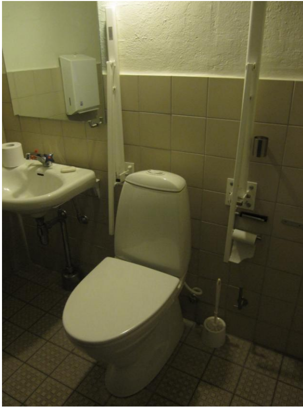
Illustration 19 - Handicaptolietet

Toilettet og håndvasken er placeret på og opad den samme væg.