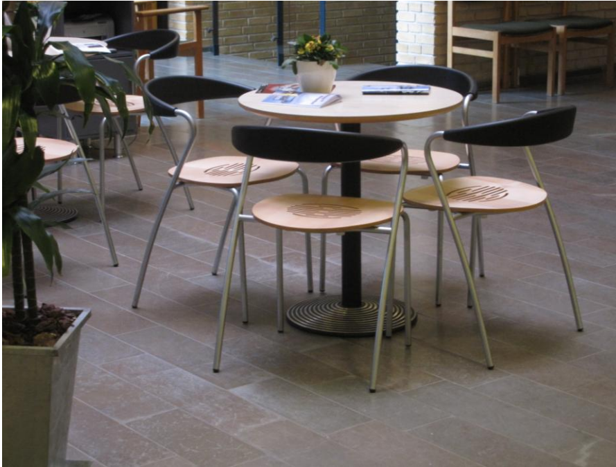
Illustration 6 – Venteområdet i Borgerservice

Bordene vil på grund af udformningen, med kun ét ben og uden sarg, også kunne bruges af kørestolsbrugere.