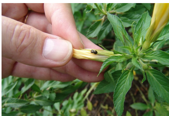
Inspektion af nytteplanter og nyttedyr

Ad. 2. Der monitoreres for skadedyr ved direkte optælling på blade. Stikprøvevis afskæres blade fra palmer efter et jævnt mønster i hele plantagen. Optælling foretages af optællings-sjak