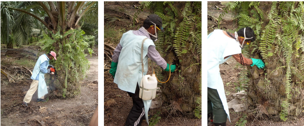
Injektion af monocrotophos, hvor der først bores et 15 cm hul, hvorefter 10 ml monocrotophos indsprøjtes og sidst lukkes hullet med en lerblanding.

I tilfælde, hvor palmerne er angrebet af skadedyr, og det konstateres, at skadetærsklen er overskredet, køres en brugsopløsning af monocrotophos ud i plantagen, hvor sprøjtehold af tre uddannede personer foretager indsprøjtningen af stoffet. Én person borer et dybt hul i stammen, en anden person foretager indsprøjtningen, og en tredje person lukker borehullet med en lerblanding (se billedserie).