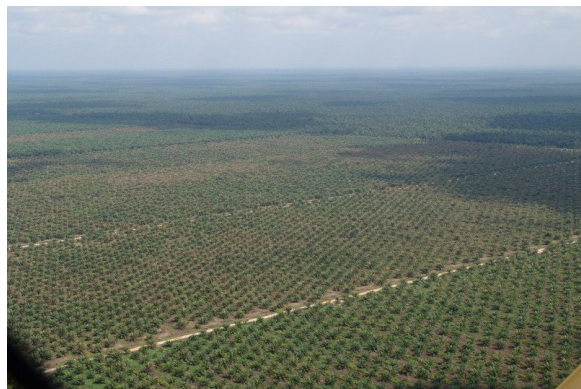
Luftovervågning af oliepalmer – til højre ses et område der er ramt af angreb.

Ad. 4. Konstateres der angreb over skadetærsklen på træer, der er yngre end 6 år, foretages der udbringning af mikrobiologisk bekæmpelse vha. Bacillus thuriengensis (’Dipel’).