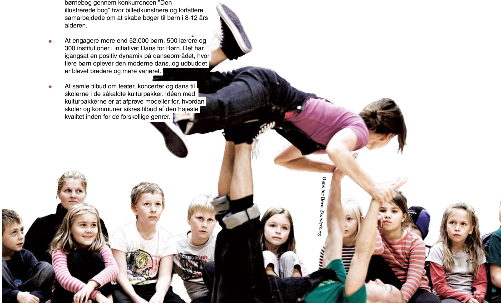
Dans for Børn, Skanderborg