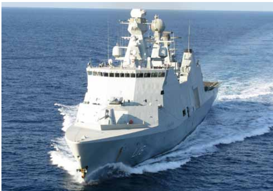
Det danske skib Absalon.

nem resolutionerne 1851 (2008), 1897 (2009), 1950 (2010) og 1976 (2011) sat rammerne for de internationale bestræ-