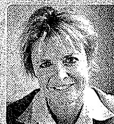
Klima- og energiminister Lykke Friis