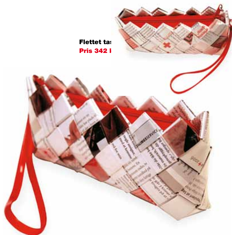
Flettet ta: Pris 342 l

Sjovt og lærerigt brætspil, hvor du lærer en masse om førstehjælp. Spillet er specielt udviklet til børn fra 10 til 14 år. Pris 448 kr.