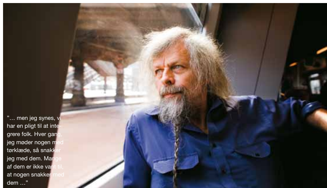
"... men jeg synes, vi har en pligt til at integrere folk. Hver gang, jeg møder nogen med tørklæde, så snakker jeg med dem. Mange af dem er ikke vant til, at nogen snakker med dem ..."