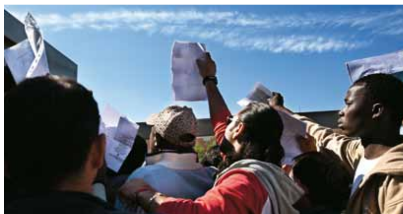
En politistation i Athen er det primære sted, man kan søge asyl. Ca. 2.000 mennesker står normalt i kø, når kontoret er åbent. Der bliver registreret 20 ansøgninger om dagen.