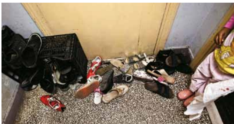
Registrerede asylansøgere får ingen støtte til at klare deres daglige udgifter til trods for, at Grækenland ifølge græsk lov kan give dem det. Mange lever i akut armod.

Se hvordan familien har det i dag på www.drk.dk/nazia