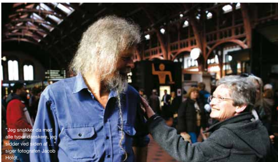
"Jeg snakker da med alle typer danskere, jeg sidder ved siden af ..." siger fotografen Jacob Holdt.