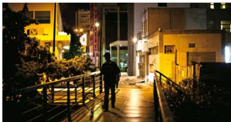
Asylansøgere skal oplyse en adresse, men for mange er det umuligt, da de bor på gaden. Det betyder, at myndighederne ikke kan fortælle dem om udviklingen i deres sager.