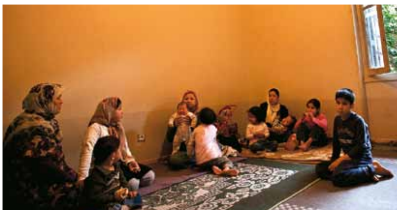
Grækenland har 811 sengepladser til registrerede asylansøgere. Næsten 20.000 søgte asyl i 2008. Derfor bor asylansøgere i parker, på gaden eller som her i en nedslidt bygning.