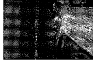
Byg bro til fremtiden