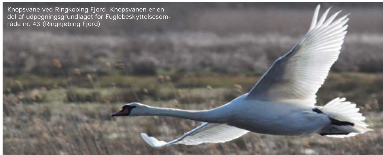
Knopsvane ved Ringkøbing Fjord. Knopsvanen er en del af udpegningsgrundlaget for Fuglebeskyttelsesområde nr. 43 (Ringkøbing Fjord)

Planerne for projektet er omfattet af lov om Miljøvurdering