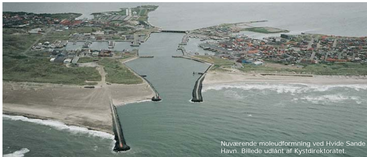
Nuværende moleudformning ved Hvide Sande Havn. Billede udlånt af Kystdirektoratet.

Debatoplægget er udarbejdet af Ringkøbing-Skjern Kommune i henhold til Planlovens § 23c om indkaldelse af forslag og ideer m.v. med henblik på planlægningsarbejdet. Debatperioden varer 4 uger fra den 21. oktober 2009 til den 18. november 2009.