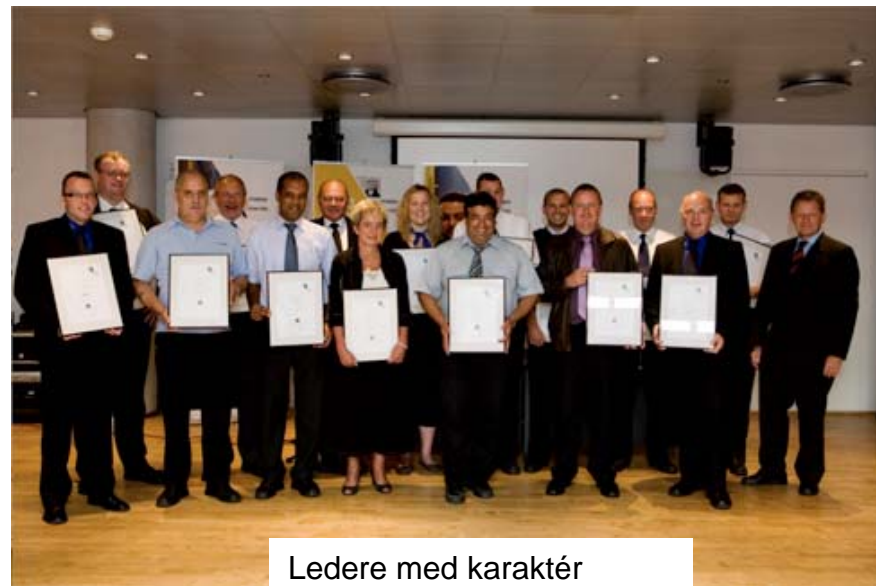
Ledere med karaktér