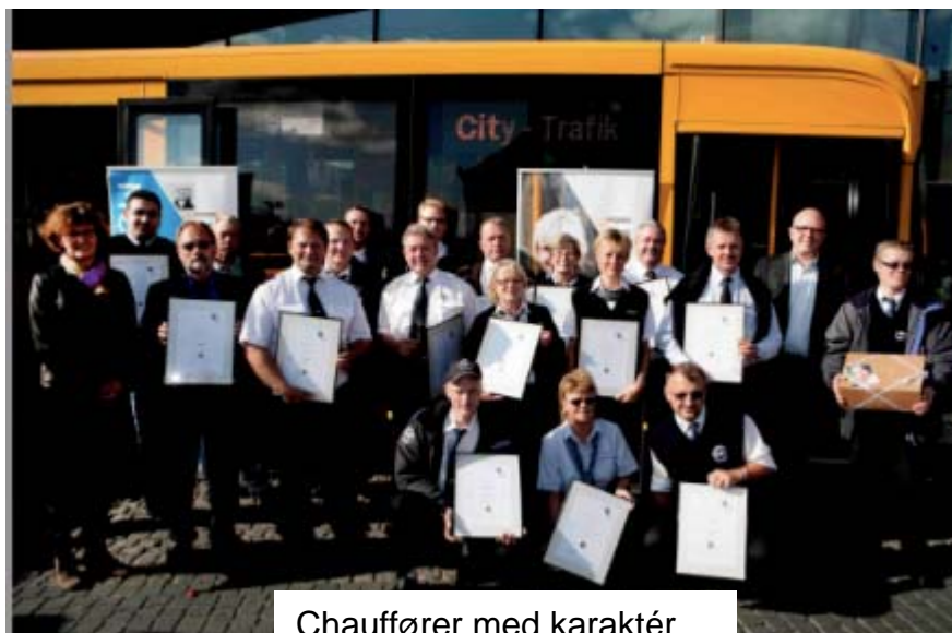
Chauffører med karaktér