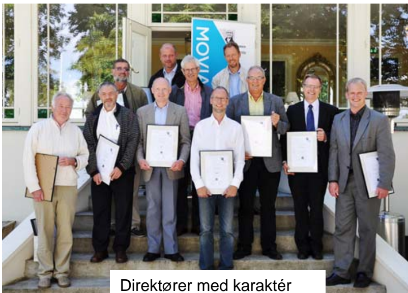
Direktører med karaktér