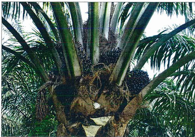
ETIK ELLER AFKAST. Flere pensionskasser har penge i United Plantations, der sidder i gav et overskud på over en halv milliard kroner efter skat.

Derimod er AP Pension, som har aktier i United Plantations holdingselskab, United International Enterprises, lidt mere direkte: »Vi kan selvfølgelig ikke acceptere, at vi investerer i virksomheder, der bruger far-