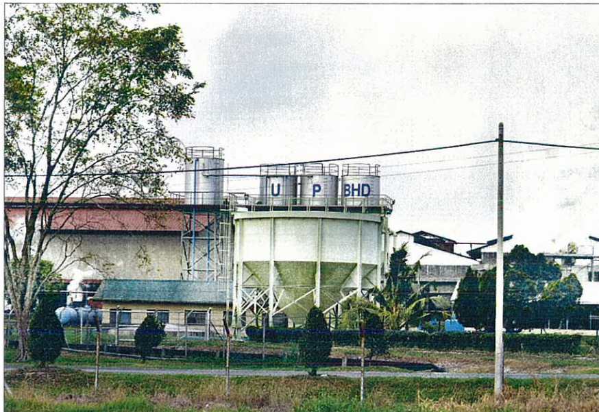
HOVEDKONTOR. United Plantations siger, at de laver sundhedsstjek på deres arbejdere. Men de arbejdere, som Politiken har talt med, siger, at de sjældent får hjælp på United Plantations sundhedsklinikker.

United Plantations havde sidste år et underskud på over en halv milliard kroner efter skat. Virksomheden afviser alle beskyldninger om, at arbejderes sikkerhed ikke er i orden.