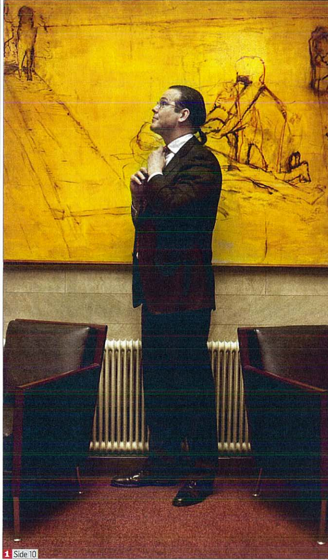
1 Side 10 En borgerlig finansminister med hestehale og guldring i venstre øre er ikke hverdagskost. Han ligner faktisk en kombination af en børsmand og en anarkist. Mens store dele af Europa er ramt af krise, kan Sverige sænke skatterne og fremvise økonomiske vækstrater, der med Anders Borgs egne ord fint tåler sammenligning med de succesrige asiatiske lande.