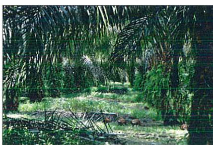
HÅRDT ARBEJDE. Ud over sprøjtearbejdere har dansk-kontrollerede United Plantations også ansat mange medarbejdere - især kvinder - til at indsamle palmetræfrugterne fra træerne.

Kvindernes normale arbejdsdag er på otte timer, men ofte arbejder de over for at tjene ekstra penge. Arbejdet begynder klokken 6.30 om morgenen, hvor de bliver kørt ud i den del af plantagen, hvor der