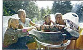
Besøgsrekord i Fårup Sommerland

FØRLYSTELSE. Med godt 602.000 gæster sætter det nordjyske sommerland Fårup besøgsrekord for 6. år i træk. Besøgstallet er i år steget med knap 21.000 i forhold til året før. Fårup Sommerland kan også glæde sig over øget popularitet blandt norske gæster. Antallet af norske besøgende steg med 38 pct.