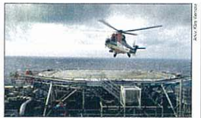
Mærsk investerer mia. i Nordsøen