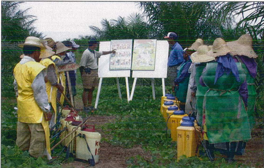
Billede 1: Oplæring af ansatte om sikker brug og omgang med pesticider og sikkerhedsudstyr. Billedet blev brugt i årsrapporten 2007.

5.2 Sikkerhedsudstyr uddeles, og dette registreres som dokumentation. Malaysiske DOSH (Department Of Safety and Health) myndigheder besøger hver af United Plantations' plantager mindst en gang om året for at overvåge, hvorvidt selskabet rutinemæssigt anvender denne praksis, og denne arbejdsgang er nøje blevet overholdt.