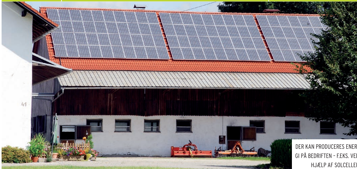
DER KAN PRODUCERES ENERGI PÅ BEDRIFTEN – F.EKS. VED HJÆLP AF SOLCELLER

Økologiske landmænd udvikler naturplaner og fører dem ud i livet, så økologiske landbrug får flere hegn, læbælter og levesteder for vilde dyr og planter. Vi vil sikre, at den naturlige balance i landbrugets øko-system kan fortsætte trods forandringer i klimaet.