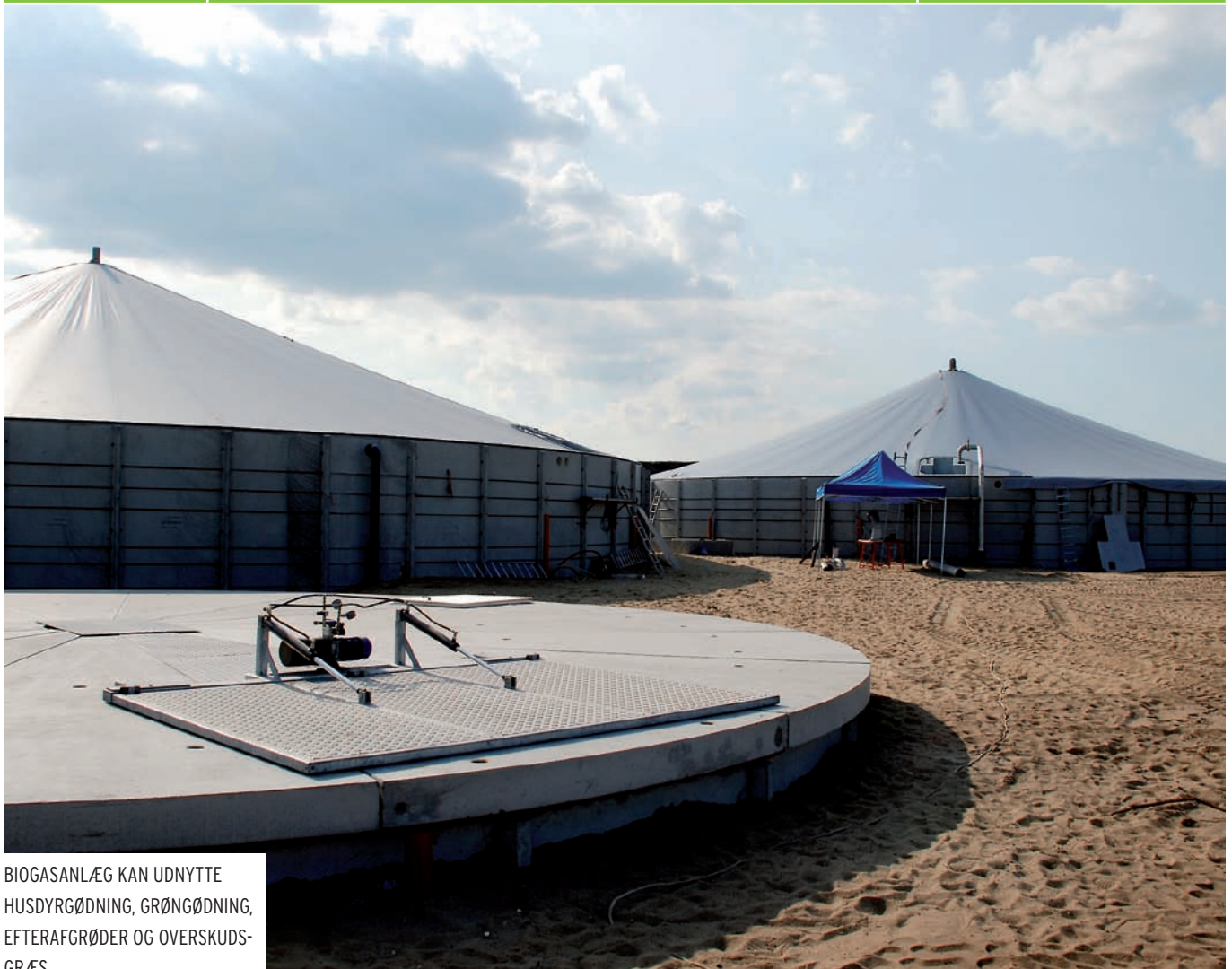
BIOGASANLÆG KAN UDNYTTE HUSDYRGØDNING, GRØNGØDNING, EFTERAFGRØDER OG OVERSKUDSGRÆS