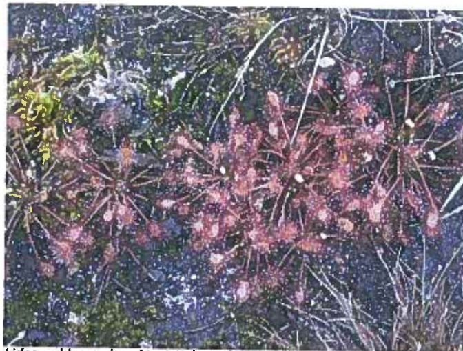
Liden soldug er karakteristisk art for tørrelavninger, som hører til blandt de mest kvælstoffølsomme naturtyper.

Derudover skal der gøres en særlig indsats mod opsplitningen af naturarealerne: