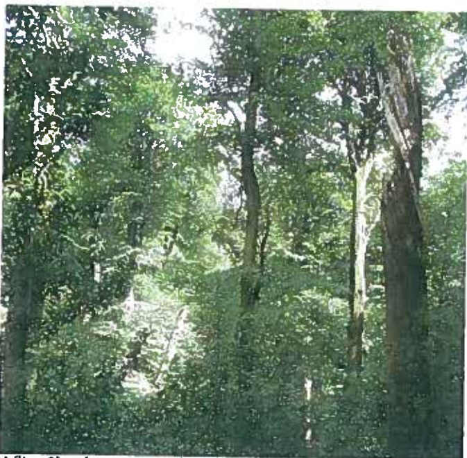
Velling Skov har store arealer med bog på mor med kristtom. Skoven har meget lang kontinuitet og høj naturkvalitet. Mængden af dødt ved er nu stigende, efter at skoven er udlagt som naturskov. Det har stor betydning for hulrugende fugle og for svampe- og insektlivet.

Sikring af ikke-beskyttet natur skal ske gennem: