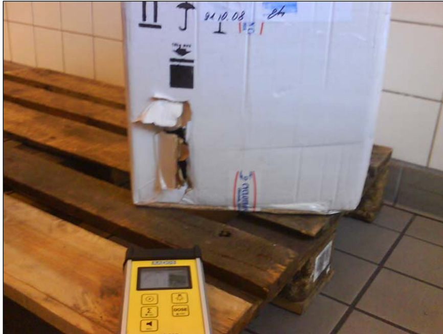
Figur 2. Kontrolmåling af beskadiget forsendelse, Kastrup 2008

Fra udlandet foreligger der, som i de øvrige år, beretninger i faglitteraturen om hændelse og uheld under transport af radioaktive stoffer. Ingen af disse hændelser har som følge af stråling medført påviselig sygdom eller død for de involverede personer. I nogle få tilfælde har der været tale om betydende stråledoser til personer. Årsagen hertil har, helt overvejende været at finde i afsenderens svigtende kontrol af dele af de benyttede transportbeholdere eller mangelfuld kontrolmåling af kolli før afsendelse.