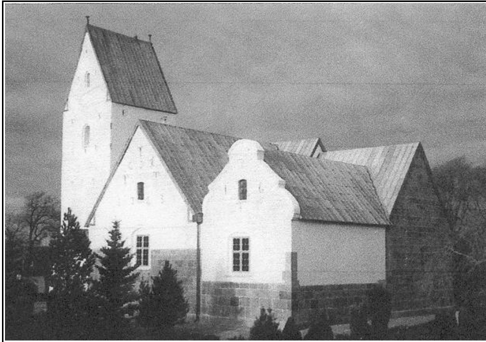
Ulfborg Kirke tre km syd for Nørre Vosborg. Gyldenstiernes Kapel ses helt til højre. Det var på det hvælvede loft over kapellet, man fandt et drengelig omkring år 1850