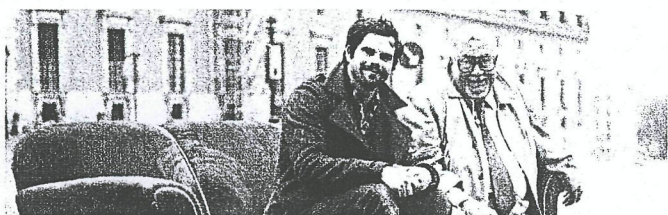
123 SAKER SOM (SVT)