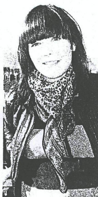
PACKAT OCH KLART (SVT)