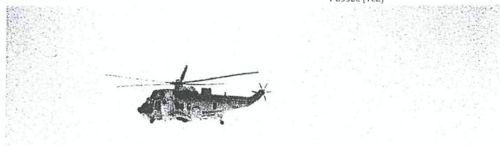
330 SKVADRONEN (NRK)