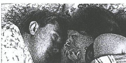
LIVET I FAGERVIK, SVT (NRK, YLE)