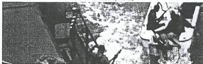
SOS - FANGET AF PIRATER, DR (SVT)