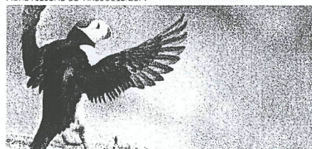
UT I NATUREN (NRK)