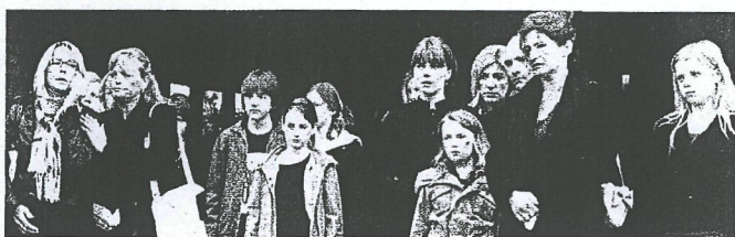
MILLE, DR (NRK, SVT, YLE)