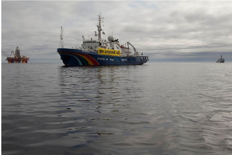
Esperanza med Stena Don og et inspektionsskib i baggrunden.

Ligeledes har Greenpeace sendt skibet Esperanza til området for olieeftersforskningen, for at skabe opmærksomhed om organisationen og dens synspunkter. Skibets færd har været genstand for stor medieinteresse og det er blevet fulgt tæt af myndighederne fra politi og forsvar.