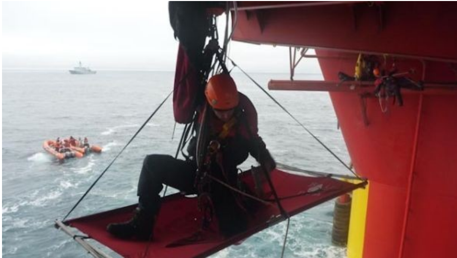
En aktivist på Stena Don.

tilsidesætter demokratiske spilleregler. Der er desuden tale om en grov overtrædelse af de sikkerhedsforhold, der skal beskytte menneskeliv og miljø. - Det er særdeles bekymrende, at Greenpeace i sin jagt på medieopmærksomhed med alle midler overtræder de sikkerhedsbestemmelser, som skal beskytte menneskeliv og miljø. Naalakkersuisut tager afstand fra den ulovlige aktion, men vi har samtidig tillid til, at politiet og de udøvende myndigheder også fremover sikrer, at de lovsikrede erhvervsaktiviteter kan fortsætte uforstyrret, siger Kuupik Kleist.