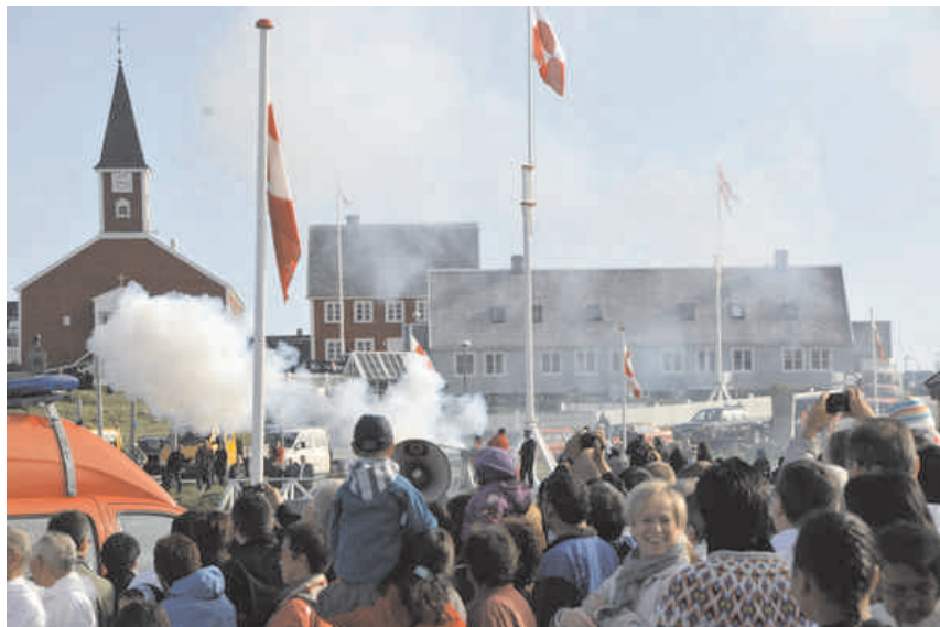
(Billede fra Kolonihavnen i Nuuk. Se Kommuneqarfik Sermersooq's hjemmeside www.sermersooq.gl .)

Som altid blev Grønlands nationaldag fejret overalt i Grønland. I Nuuk indledtes nationaldagen traditionelt med procession fra rådhuset til Kolonihavnen og salutering i Kolonihavnen.