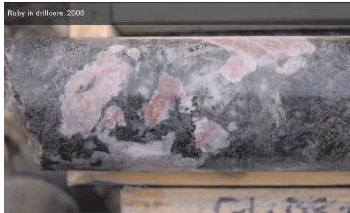
Foto af boreprøve med rubiner fra www.truenorthgems.com

Rubinforekomsten ved Vestgrønland har siden 2004 været genstand for en ganske omfattende efterforskning v. selskabet True North Gems Inc.