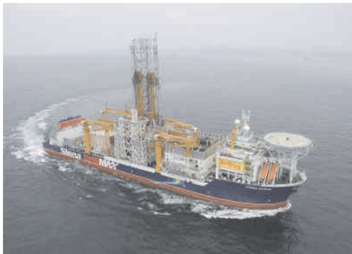
Boreskibet Stena Forth, som skal bore for Cairn Energy. www.knr.gl .

Grønlands Selvstyre oplyste den 21. december 2009, at selskabet Cairn Energy planlægger at gennemføre en eller flere efterforskningsboringer i havet vest for Disko og Nuussuaq halvøen i løbet af 2010. Det vil da være første gang i 10 år at et selskab med tilladelse til kulbrinteefterforskning gennemføre en prøveboring.