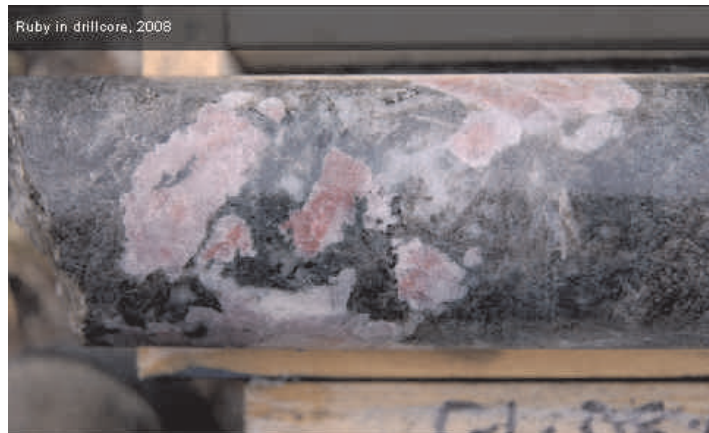
Foto af boreprøve med rubiner fra www.truenorthgems.com

Rubinforekomsten ved Vestgrønland har siden 2004 været genstand for en ganske omfattende efterforskning v. selskabet True North Gems Inc.