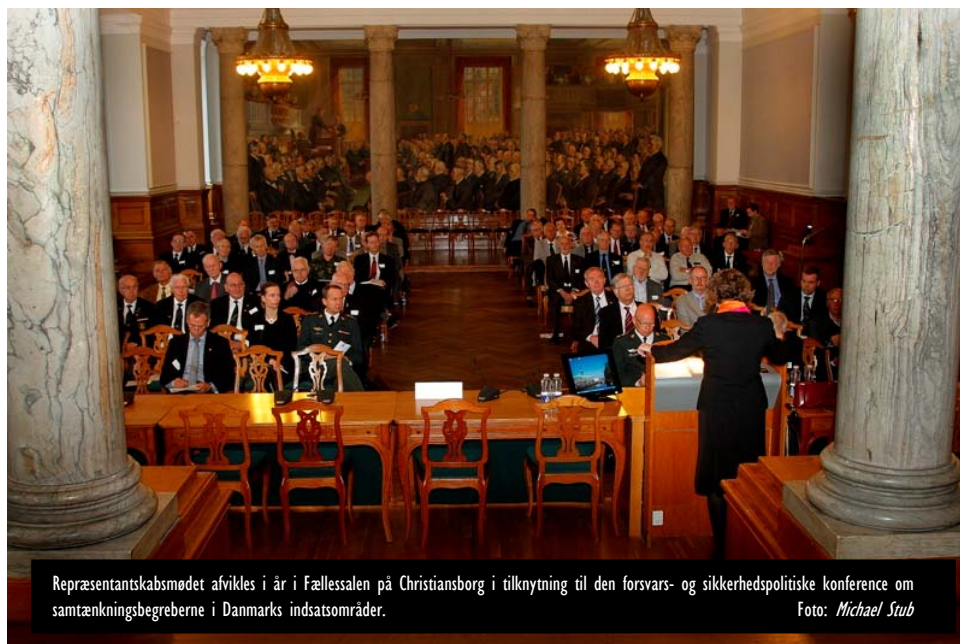
Repræsentantskabsmødet afvikles i år i Fællessalen på Christiansborg i tilknytning til den forsvars- og sikkerhedspolitiske konference om samtænkningbegreberne i Danmarks indsatsområder.

Folk & Forsvar savner i forligsteksten et mere dybdeborende fokus på beredskabet og herigennem øgning af frivillighedsbegrebet, så vi derved fremmer og styrker det robuste samfund. Men vi glæder os i den forbindelse over opgraderingen af Hjemmeværnet og Reserven.