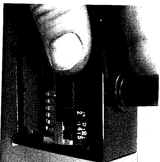
Indstil til at stemple 2 gange