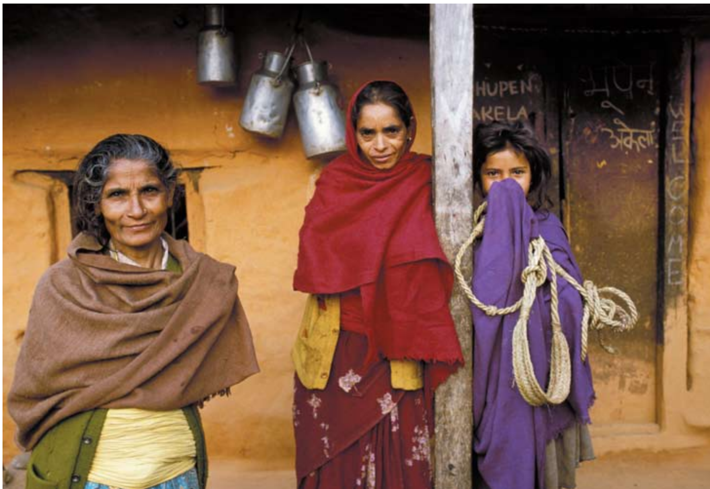
Kvinder i Nepal, hvor Danmark blandt andet støtter kapacitetsudvikling af organisationer, som søger at skabe større bevidsthed om kvinders rettigheder.