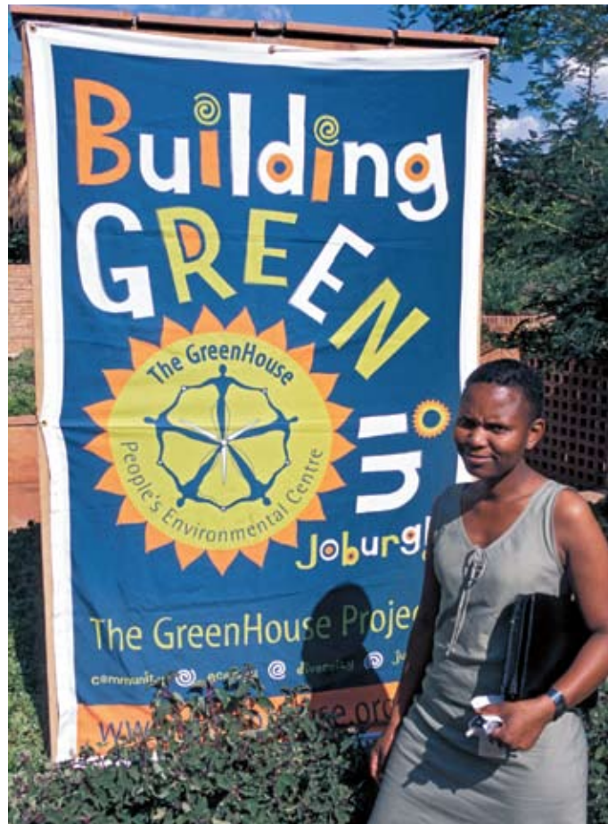
Sydafrikansk organisation søger at inspirere lokalbefolkningen i Johannesburg til initiativer, der kan fremme udviklingen mod en grønnere by.

Der vil fortsat blive ydet danske bidrag direkte til aktiviteter, som lokale civilsamlundsorganisationer gennemfører. Danmark vil arbejde for, at der i programsamarbejdslandene anvendes forskellige støttemekanismer, således at der ikke opstår afhængighed af hverken stat eller enkeltstående finansieringsinstitutioner. Fra ambassadernes side vil man løbende føre en åben dialog med de stedlige myndigheder om, hvordan donorer som Danmark bedst støtter civilsamlundsorganisationens udvikling.