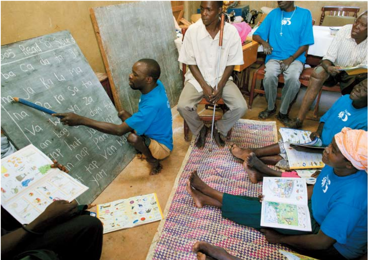
Handicappede og tiggere undervises i matematik, sprog og syning gennem et projekt i Uganda.