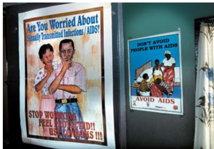
Plakater i Ghana informerer om risikoen ved hiv/aids.

Kapacitetsudvikling vil ofte også indeholde overførsel af viden og erfaringer, f.eks. fra danske eller andre samarbejdspartnere, der har en særlig relevant faglig, teknisk eller organisatorisk baggrund.