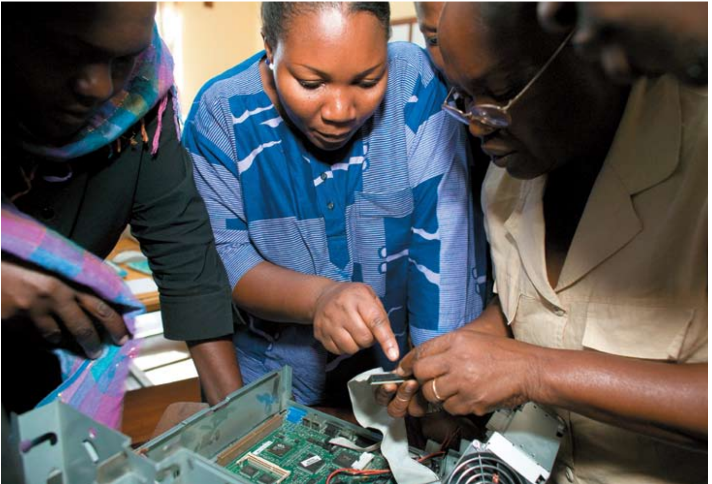
Lærere i Kampala undervises i computere af et ugandisk firma. Firmaet samarbejder med et dansk firma om vidensdeling og distribution af computerudstyr.