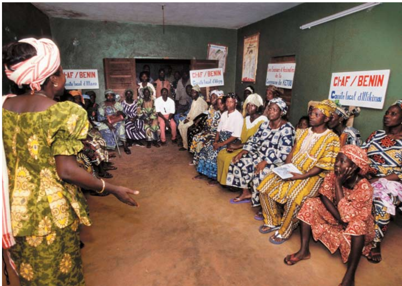
Lokal komite i Benin planlægger kampagne mod omskæring af piger.