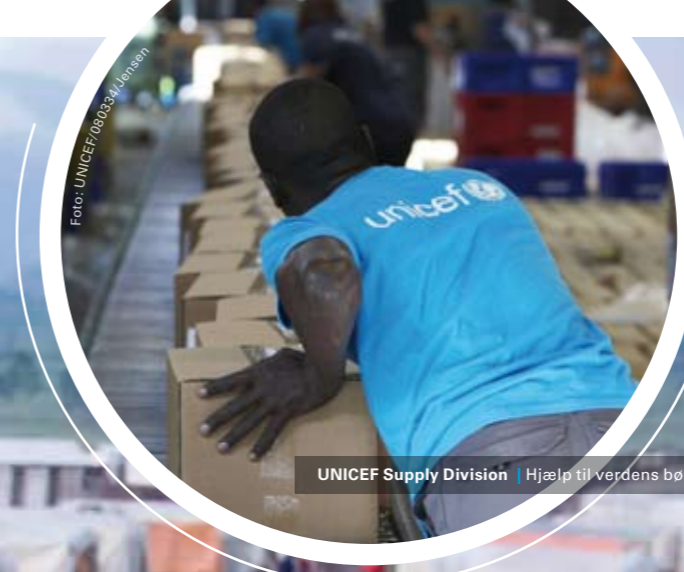
UNICEF Supply Division | Hjælp til verdens børn sendes fra verdenslageret i København

UNICEF Danmark har godt 56.000 Partnere – privatpersoner, der betaler et fast månedligt bidrag til UNICEFs hjælpearbejde for børn. De faste bidrag er så vigtige, fordi de sætter UNICEF i stand til at planlægge hjælpearbejdet langsigtet. I 2008 oplevede vi, hvordan mange mennesker, der bidrager til UNICEFs arbejde med små og store beløb, også støtter UNICEF på mange andre måder – f.eks. ved at købe UNICEFs kort og produkter, give Verdensgaver fra UNICEF, eller ved at bruge Velgørenhedsknappen på sin lokale flaskepantautomat. Det er blandt andet de mange små beløb, der gør UNICEF Danmark i stand til hvert eneste år at øge sin hjælp til verdens mest udsatte børn. Det overskud, der gik direkte til UNICEFs internationale hjælpearbejde for børn i 2008, var næsten 11 gange større end for 10 år siden.