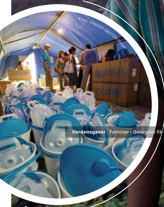
Verdensgaver Familier i Georgien fik udstyr til rent vand

Gaver til verdens børn | Med Verdensgaver har danskerne fået et alternativ til mere traditionelle måder at støtte UNICEFs hjælpearbejde på. Og rigtig mange har taget det nye gavekoncept til sig. Før jul 2008 havde danskerne for eksempel købt myggenet til knap 1.645 familier, skoleudstyr til 155.400 skoleelever og vacciner til 234.080 børn. Verdensgaverne er nøje udvalgt blandt de mange hjælpeartikler, som UNICEF hver dag året rundt sender til børn i verdens fattigste lande fra UNICEFs verdenslager i Københavns Frihavn. Hele UNICEFs globale distribution af forsyninger bliver styret fra verdenslageret, og det er også på dette enorme lager, at hovedparten af Verdensgaverne bliver pakket og sendt af sted til verdens børn. De mange danske Verdensgaver har hjulpet tusindvis af børn i 57 forskellige lande, og i 2008 har især katastroferamte børn i lande som Myanmar, Madagaskar og DR Congo fået gavn af Verdensgaverne.