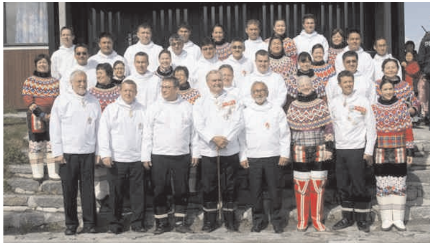
Inatsisartut og Naalakkersuisut fotograferet foran Inatsisartut 's mødesal, sammen med Regentparret, Kronprinsparret, statsministeren og Folketingets formand.

- samlet de taler mm., der fremkom under den officielle markering af selvstyrets indførelse i Grønland den 21. juni 2009.