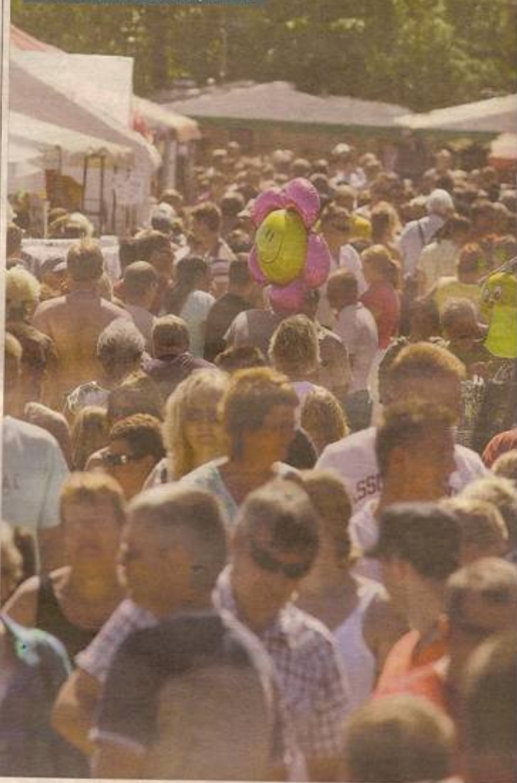
HJALLERUP MARKED er slut, og arrangørerne kunne ud på eftermiddagen søndag opre status med...