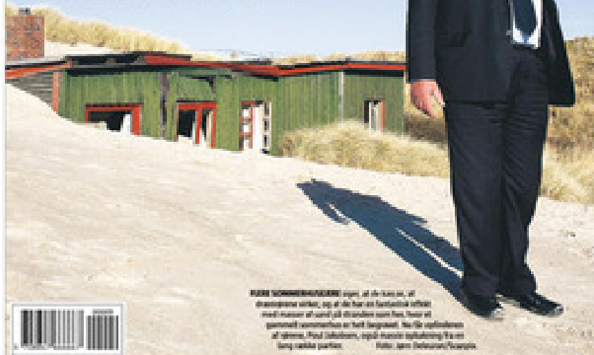
LENS TRANSPORTMINISTER Lars Barfoed (K) er også med på tvillingetegnets fornyelse i Skoleoplysningsloven og for tredje gang i år. Den tredje gang "oplysningsloven", som vil handle om at bringe sig og andre ting.