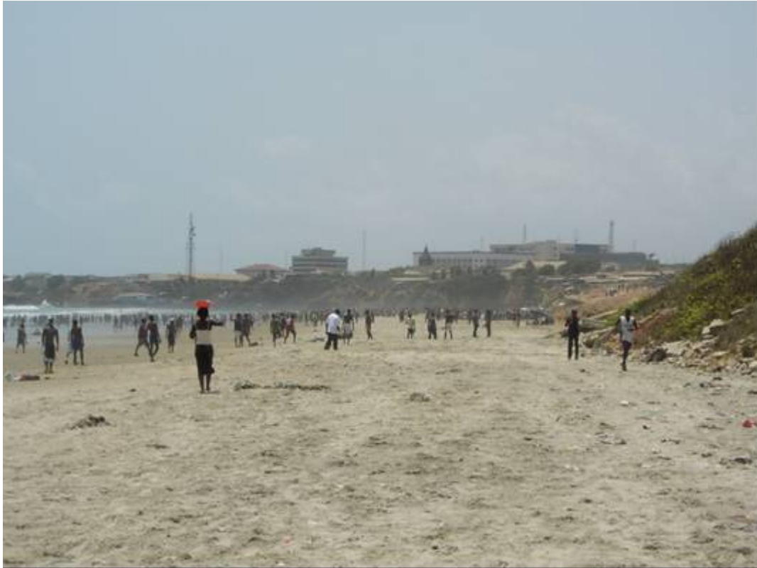
The re is no cliff erosion in the area's with PEM