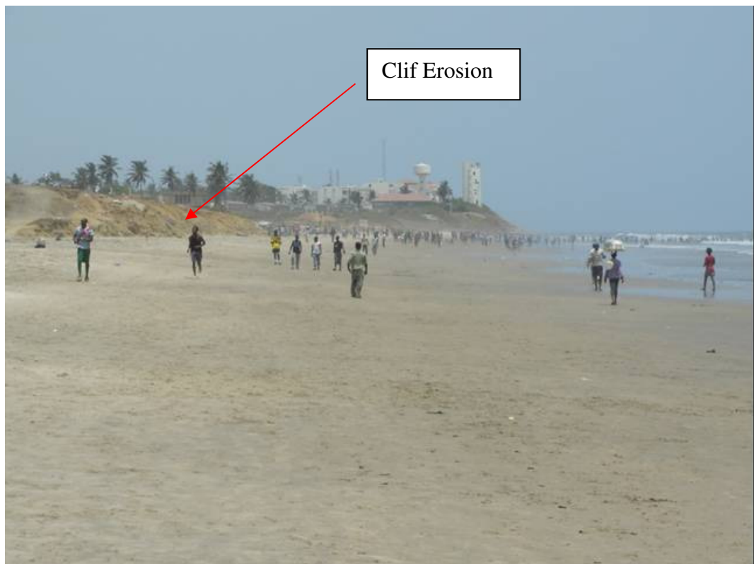
The Beach is low with cliff erosion outside the PEM area.

The Project is done in cooperation with the Mnistry of Works and Housing in Ghana.