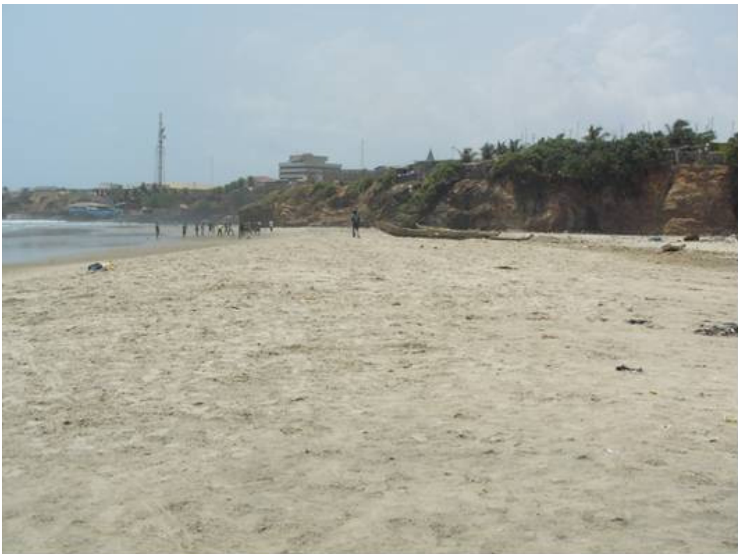
The Beach is 20 – 40 metres wide by high tide