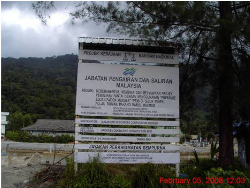
Pressure Equalization Module PEM