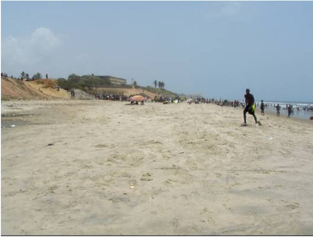
Accra beach the 9 March 2008.